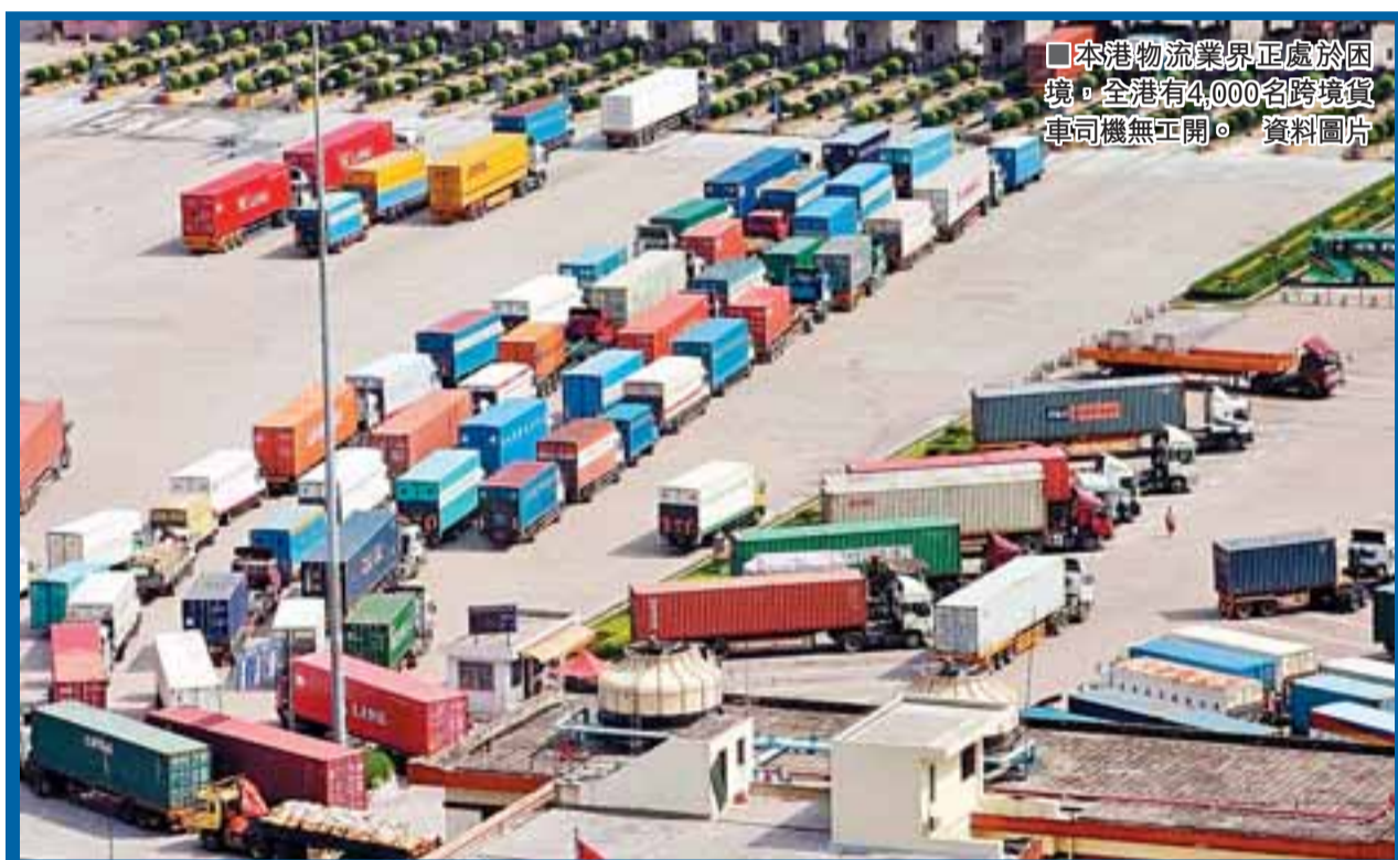
本港物流業與內地受困，全港逾4,000名跨境貨車司機無工開。資料圖片

物流貨運業為本港經濟支柱之一，工聯會聯同內地學者，就振興本港物流業進行研究。負責研究的中山大學港澳珠三角研究中心教授鄭天祥建議，本港未來要爭取珠江三角洲西部地區的貨源，透過避險及鐵路配套，以維持穩定的貨運量增長，也能避免與深圳港口競爭。他又認為，目前雖面對貨量下跌，但興建貨櫃碼頭時，由前期規劃直建至最少10年，相信屆時本港碼頭吞吐量將會飽和，建議政府興建10號貨櫃碼頭。