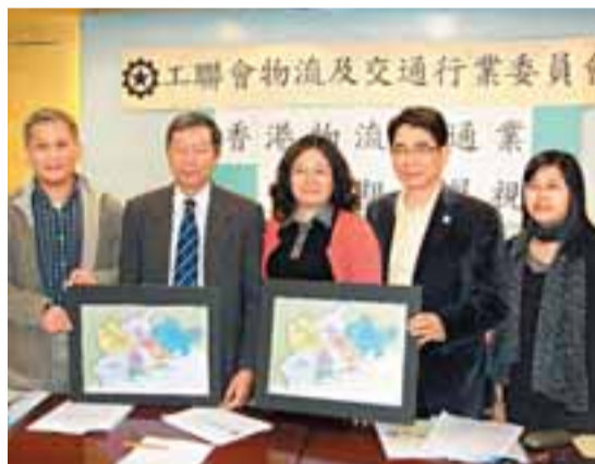
物流貨運業為本港的支柱行業，工聯會聯同內地學者，就振興本港物流業進行研究。

【本報訊】(記者 鄭啟源)全球經濟疲弱，貿易活動放緩，物流貨運業大受打擊。工聯會指出，本港物流業界正處於困境，全港逾1.3萬名粵港跨境貨車司機，有4,000、即超過3成人正處於停工狀態，其餘則面對開工不足問題，收入大跌3成，有物流公司已強制要求員工每月放4天無薪假。工會擔心市況持續欠佳，本月底會掀起物流貨運業倒閉、裁員潮。