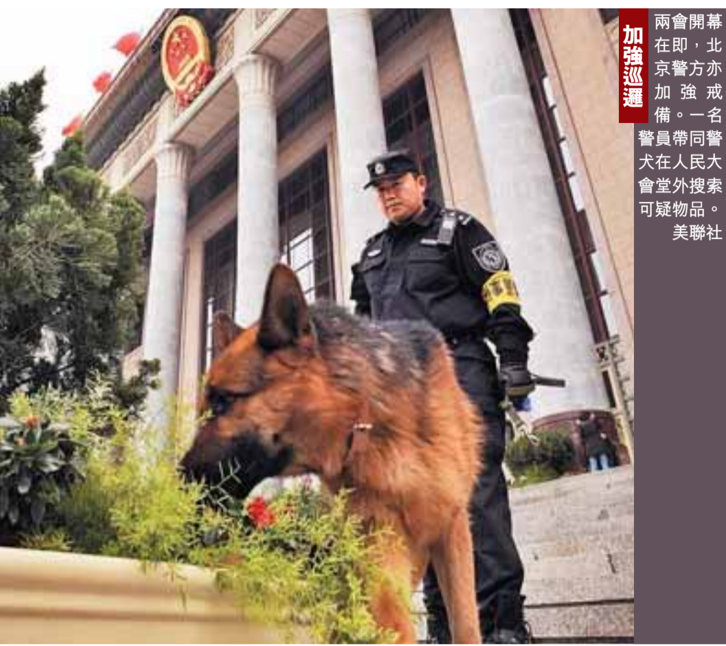
兩會開幕在即，北京警方亦加強巡邏。一名警員帶同警犬在人民大會堂外搜索可疑物品。

但文章強調，由於這些代表委員所在的上市公司，大多是大型央企，或者為地方行業巨頭，所以他建議，決策機關在聽取、採納上市公司代表、委員建議時，應應特別防範「決策加劇壟斷」的傾向。同時，也應該給予更多民營企業、中小企業代表在全國兩會上「出聲」的機會。