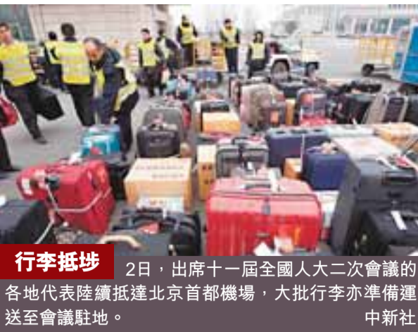
行李堆埗 2日，出席十一屆全國人大二次會議的各地代表陸續抵達北京首都機場，大批行李亦準備運送至會議駐地。中新社

葉培建解釋「回」的意思，就是讓探測器到月球上面「抓一把東西，再帶回地球上來」。也就是說，第三期工程不僅要完成「落」的全部過程，還要實現探月衛星的返回，「難度更大」。葉培建透露，嫦娥二號和三號的總指揮將由張廷新擔任，總設計師將分別由黃江川和孫澤洲擔任。