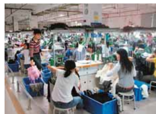
■港區人代團擬就《勞動合同法》實施時產生的副作用, 提出修訂建議。資料圖片