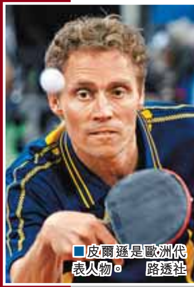
■皮爾通是歐洲代表人物。

【綜合外電】亞乒聯和歐乒聯在北京奧運會期間簽署了1項為期5年的協議，決定在今後的5年內舉辦「歐亞全明星系列賽」。該賽為年度比賽，每年在中國和歐洲的1個城市各進行1站比賽。這項協議是由亞乒聯副主席李富榮和歐乒聯主席羅斯在北京共同簽署的。