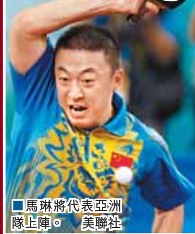
■馬琳將代表亞洲隊陣陣。