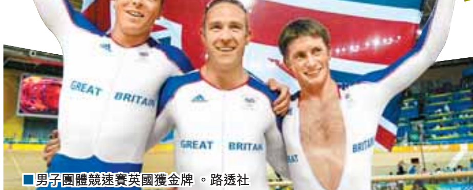
■男子團體競速賽英國獲金牌。路透社

【綜合外電】京奧閉幕後，世界的目光轉向了下屆倫敦奧運。日前，英國政府中負責奧運撥款的英國體育理事會，公佈了他們在下一個奧運周期給該國各個運動項目的撥款情況。英國政府在下一個奧運周期給各個項目的撥款總額為2.46億英鎊，比上個周期略有增加，但受益的項目卻大大減少。