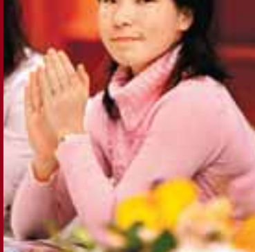
■鄭潔笑容內斂，是一位極致美人。

JB.GROUP網球精英賽2009」共邀請12位世界級球星來港競技，包括「一姐」贊高域、「大威」維納斯威廉絲、「中國金花」鄭潔及俄羅斯美女查維達迪絲等名將。而昨日大會特別舉行記者會，除「大威」因昨晚才抵港未趕及出席外，其餘球手均悉數出席，贊高域更放低「一姐」身份，表現親民及有問必答。