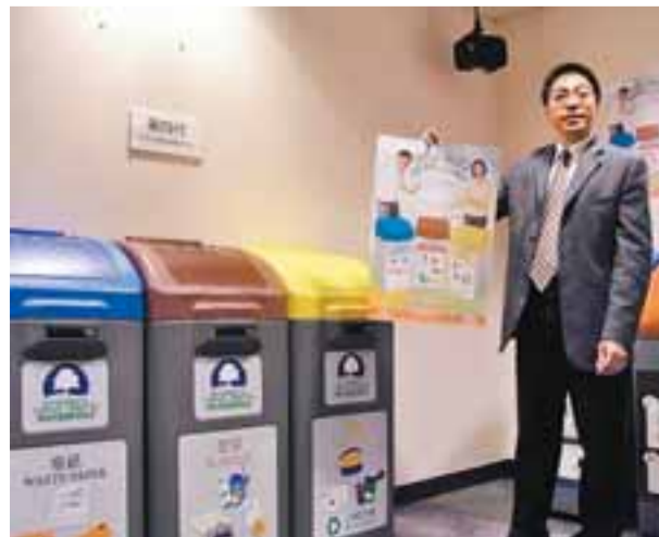
環保署首席環境保護主任黃棟剛表示，第四代三色分類回收桶已改用有防火功能的塑膠製造。

此外，本港近年回收桶收集的物料數量急跌，以食環署負責的公眾地方回收桶為例，從2003年的910公噸跌至2007年的623公噸，急跌32%，去年首10個月亦只有515公噸。黃棟剛表示，去年初回收物料價格趨升，吸引拾荒者從回收桶盜走物料，故單以回收量難以評估回收桶的成效，並指政府正逐步在垃圾桶附近增設回收桶，方便市民參與分類回收。