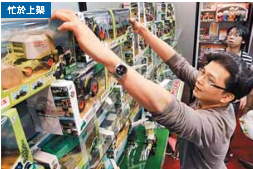
忙於上架 香港玩具展今天起一連4天於灣仔會展舉行，參展商人員昨日忙於把產品上架。