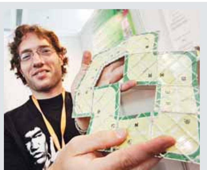
新加坡參展商MindStrat Puzzels帶來新產品「扭扭板」，玩者不停轉動扭扭板時，會呈現不同圖案。