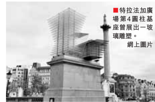
特拉法加廣場第4圓柱基座曾展出一玻璃雕塑。