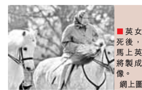
英女王死後，其馬上英姿將裝成雕像。

成在第4基座豎立二戰英雄帕克的雕像，但他可能突然知道基座預留給英女王，故突然否決了原先的計劃。自1841年起，第4基座便一直懸空，直到1999年成為暫時的現代藝術作品展示台，輪流展出不同藝術家的作品。外界一直形容這是像謎一般的「懸空基座」。 ■《獨立報》