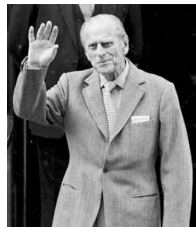
菲臘親王4月曾因肺炎入院，圖為他出院時向傳媒揮手。 資料圖片

據悉菲臘親王今次提出投訴，是因為國際汽車聯盟(FIA)會長莫斯利早前控告《世界新聞報》侵犯私隱勝訴，獲賠破紀錄的6萬英鎊(約91萬港元)。該案源於《世界新聞報》披露莫斯利與5名妓女大玩涉及「納粹」角色扮演內容的性虐遊戲，由於主審法官判案時引用了《歐洲人權公約》，認為「任何人的私生活均有獲尊重的權利」，判莫斯利勝訴。這判決亦因此被視為法庭認同「私隱權大過天」的代表性案例。 ■《每日電訊報》