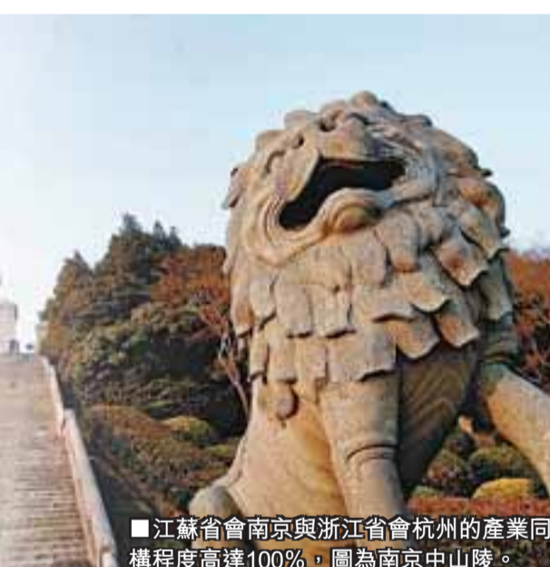
江蘇省會南京與浙江省會杭州的產業同構程度高達100%，圖為南京中山陵。