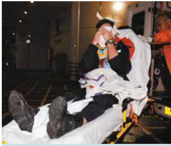
一輛警車失控撞燈柱，釀4警受傷。圖為其中一名警員頭部受傷送院。

案發後，警方如臨大敵，派出大批上選彈衣警員荷槍實彈到場搜證，氣氛緊張，證實無人受傷。其間，大埔道一段行人路、一段北河街及通往巴城街的人行隧道被警方封閉，兩名持槍劫匪，其中一匪頭戴鴨舌帽，警方事後在石硤尾22座對開截獲一輛懷疑曾被截過劫匪的士，正追緝兩槍匪的下落。