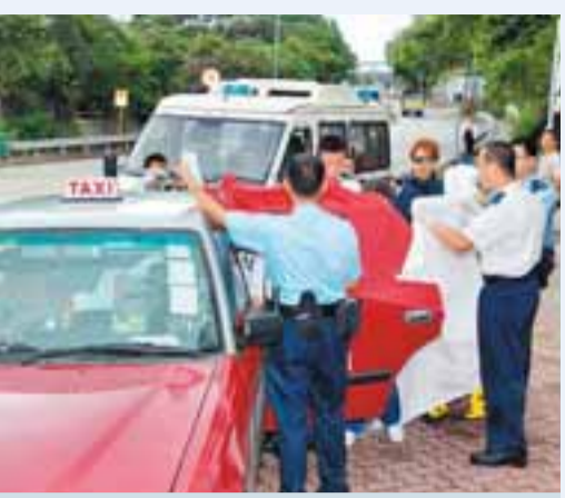
一名內地孕婦乘的士往醫院途中突然臨盆，警員圍起毛毯以待救護員替她接生。

消防員於是展開救援，但見男子陽具一直腫脹無法收縮，在苦無良策下，只好用毛氈覆蓋其下半身，並急召醫療隊及兩名聯合醫院醫生前來協助，其間男事主見有記者到場拍攝，立即大叫：「救我唔到唔緊要，最緊要唔好畀人影到我個樣……」未幾醫生到場先為他打止痛針，消防員該於是出動手提電筒，把鐵製的仰臥板4隻角鋸下，再合力將男子連人帶板抬上救護車，送往聯合醫院搶救。