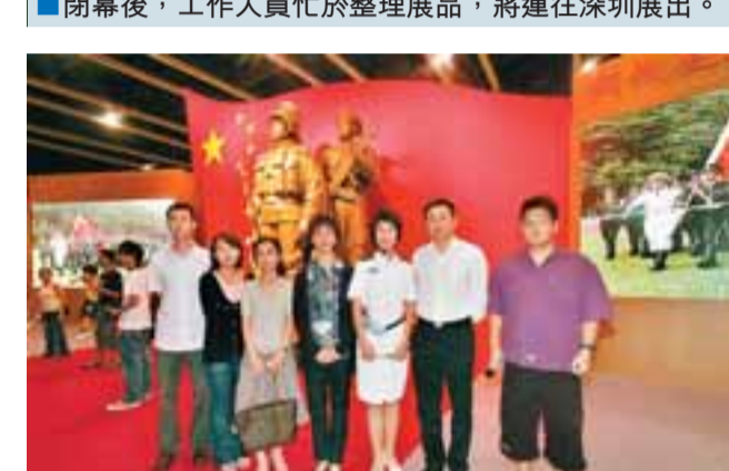
外交部駐港特派員公署的人員亦到場參觀展覽。