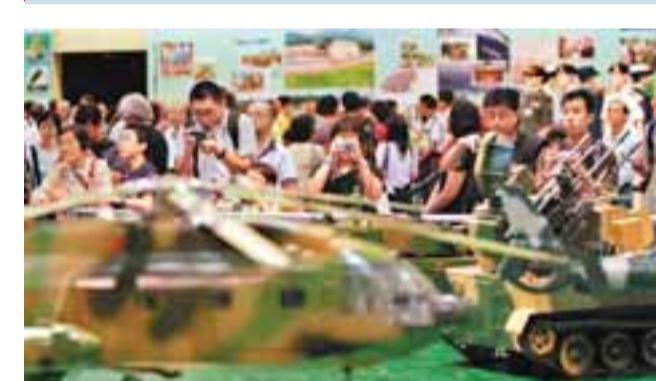
武器軍備模型繼續成為市民的「心頭好」。