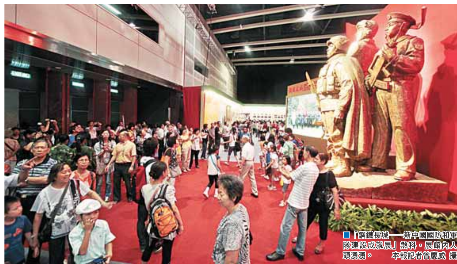
「鋼鐵長城——新中國國防和軍隊建設成就展」熱科,展館內人頭湧湧。

【本報訊】(記者沈清麗)「鋼鐵長城——新中國國防和軍隊建設成就展」昨日進入最後一天,近萬市民把握機會前往會展參觀。展館內整日人頭湧湧,比平日顯得更加熱鬧。在高峰時,展館外出現了一條長的人龍。為期7天的展覽,總共錄得51,830參觀人次,取得圓滿成功。參觀市民大都讚賞軍博展覽內容豐富、包羅萬有,為他們上了一課寶貴的軍事課程,獲益良多。