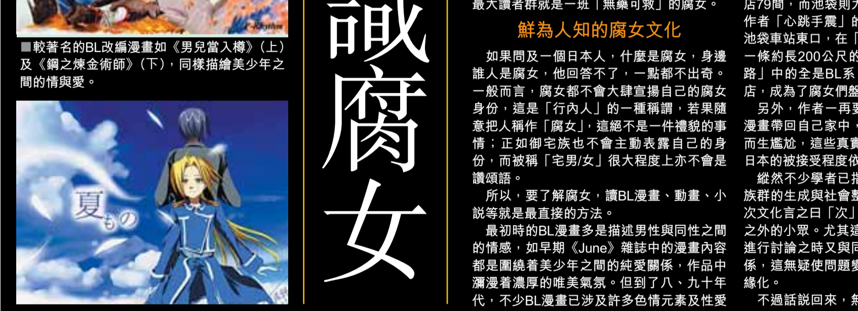
較著名的BL改編漫畫如《男兒當入海》(上)及《網之煉金術師》(下)，同樣描繪美少年之間的情與愛。