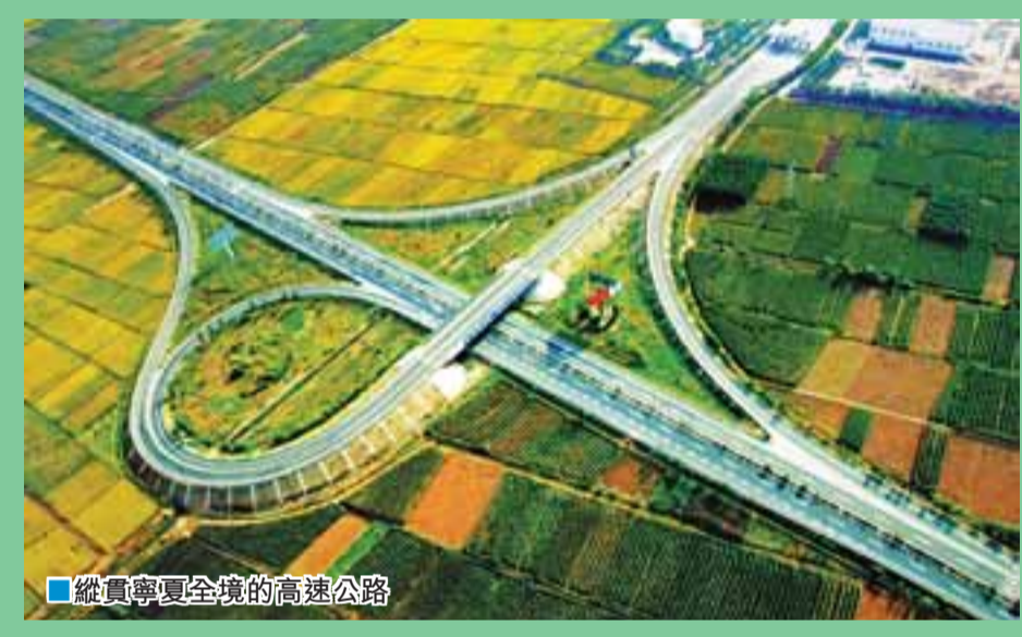
■ 總覽寧夏全境的高速公路