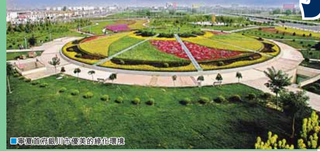
■ 寧夏首府銀川市優美的綠化環境