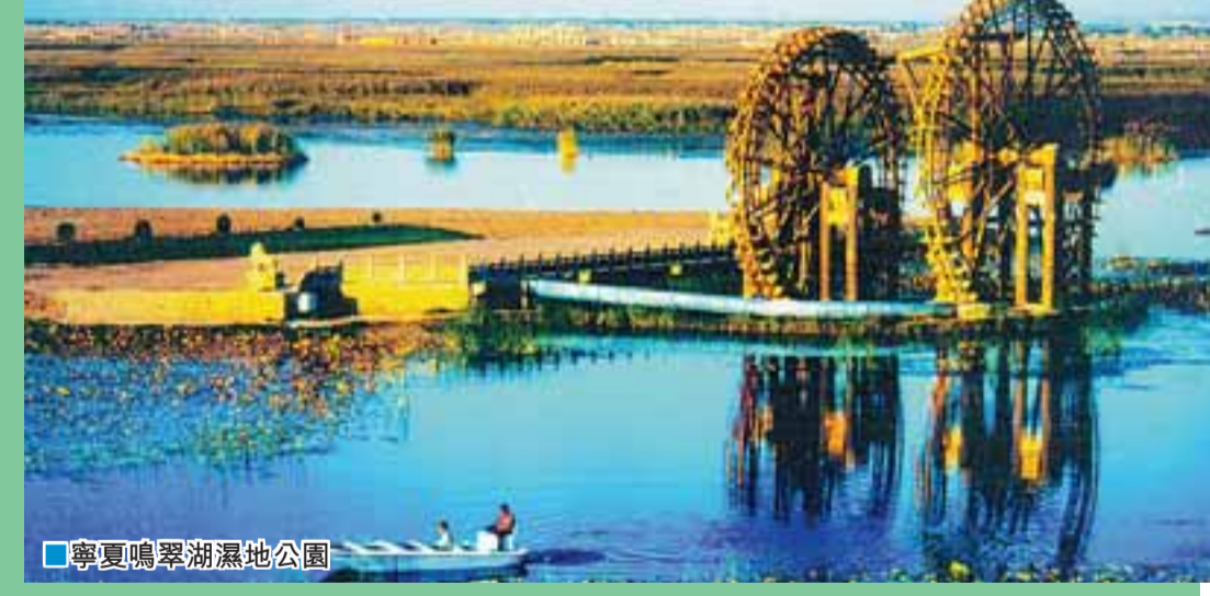
■ 寧夏鳴翠湖濕地公園