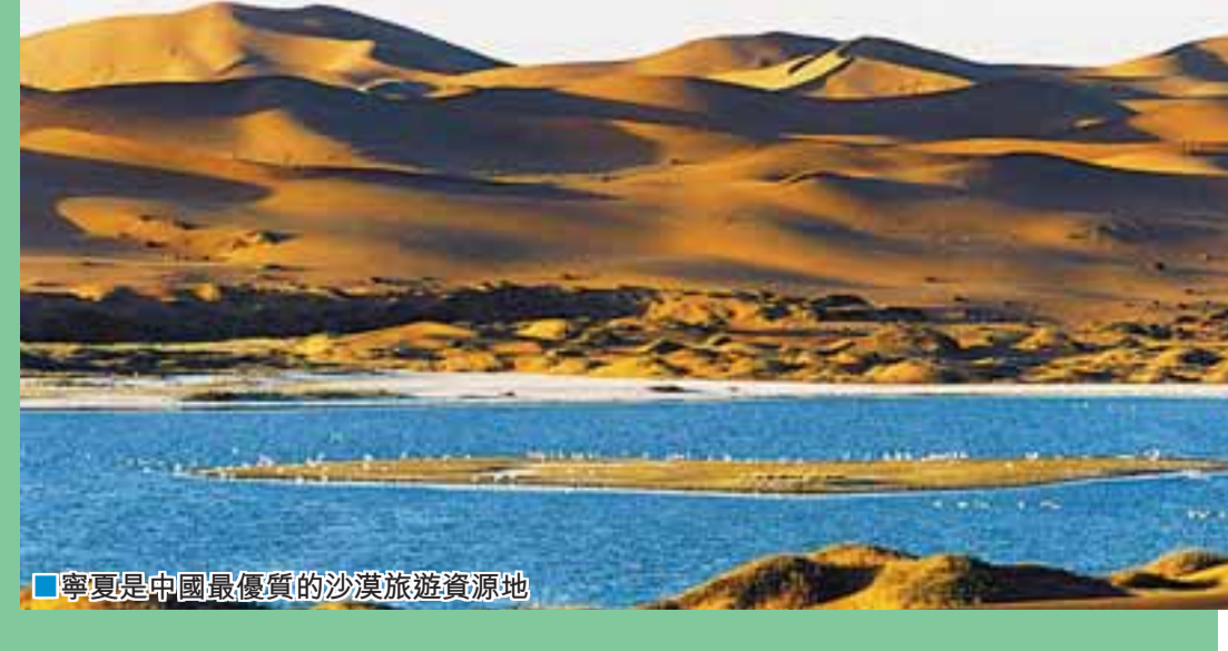
■ 寧夏是中國最優質的沙漠旅遊資源地

寧夏是我國唯一的省級回族自治區,地處西北地區,黃河中上游,面積6.64萬平方公里,人口610萬,其中回族人佔36%,轄五個地級市、22個縣、市(區),素有「塞上江南」美譽。首府銀川市是全國歷史文化名城,塞上湖城,正在建設西北地區「兩個最適宜」城市(最適宜居住、最適宜創業)。