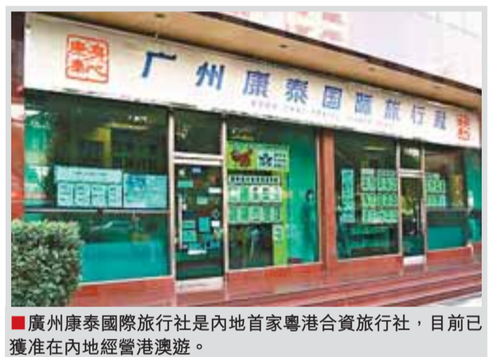
廣州康泰國際旅行社是內地首家粵港合資旅行社，目前已獲准在內地經營港澳遊。

本報獲悉，「服務業對港澳開放」在廣東先行試政策」研討專題會議本月初低調召開，粵港相關部門官員以及中央有關專家對數十項可能的內容進行初步評估，為CEPA補充協議做最後探討和補充。 消息稱，除了CEPA補充協議外，未來港粵間旅遊還將有一系列的新規劃和大動作。香港業界人士指出，廣東正開展旅遊綜合改革實驗，包括優先掛牌辦粵港旅遊規劃等，正由國家旅遊局牽頭研究提出具體方案。一旦實施，兩地的旅遊業在共同開拓市場方面，將有更加深入的配合。