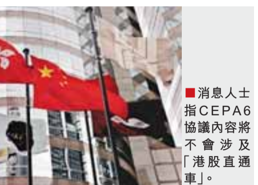
消息人士指，CEPA6協議內容將不會涉及「港股直通車」。

【本報訊】(記者 黃惠) 本港旅遊界人士分析稱，上述兩項可能寫入(CEPA6)的政策，將是重大突破，不但大大拓寬本港旅行社的服務空間，更將直接促進香港旅遊業、零售業等領域的繁榮和發展，加快深港兩地融合交流的步伐。「深圳暫住人口數量龐大，達到800多萬，過去非戶籍居民沒有渠道赴香港旅遊，這次放開屬於「釋放性消費」，為香港旅遊業、零售業、餐飲業等相關行業的進一步發展提供了巨大的商機。」 這位熟悉內情的人士還指出，深圳的周邊城市，如东莞也有上千萬的常住非本地