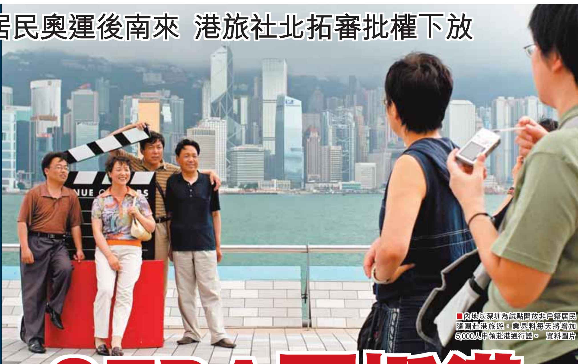
內地以深圳為試點開放非戶籍居民團赴港旅遊。業料料每天將增加5,000人申請赴港通行證。資料圖片

香港特區政府與商務部就新一輪「內地與香港更緊密經貿關係安排」補充協議五 (CEPA6) 即將於下周在港簽署。旅遊業人士向本報透露，本港服務業進入內地的新優惠政策中，旅遊業將是重點之一。而其中最重要的突破將是香港旅行社今後在廣東設立合資及獨資旅行社的審批權限，將由中央下放給廣東省，不再需要經過國家旅遊局審批。此外，將為在深暫住一年以上的非深圳籍居民辦理赴香港旅遊業務，組織形式為「定點團隊旅遊」，有望在北京奧運會後組織實施。 消息指，上述兩項政策對香港旅遊、零售及餐飲業都將是巨大的利好消息，因為僅深圳就有超過800萬非戶籍人口，而該辦法若進一步推廣到廣東其他城市，相信將每年至少多吸引2,000萬珠三角遊客來港，刺激本地旅遊、消費市場。 ■本報記者 黃惠