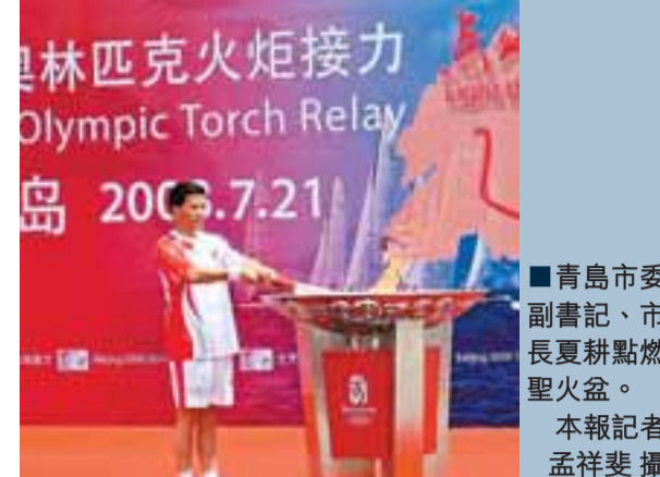
■青島市委副書記、市長夏蔚點燃聖火盆。

郭林從奧帆中心丈量碼頭下海，途中有4名火炬手在奧帆中心水域進行交接。此次青島站傳遞共有259名火炬手參與，歷時近3個小時。火炬手中包括影視演員夏雨、神舟飛船總設計師陳發劬、著名旅美小提琴家呂思清、雅典奧運會舉重冠軍唐功紅、青島港「金牌」工人許振超、青島啤酒董事長李志國、抗災救災英雄陳慶新等各界代表。