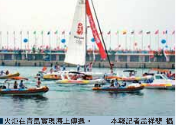
■火炬在青島實現海上傳遞。

【本報駐山東記者孟祥斐、殷江宏實地記者鄭徐光青島21日電】「祥雲」奧運聖火今起在「孔孟之鄉」山東省傳遞。首站即為與帆船賽聯名的青島。此次傳遞的最大亮點是首次實現海上傳遞。「祥雲」在數艘帆船的護航和高歌聲的歡呼中一路前行，形成一幅獨特的風景。國際奧委會和北京奧組委均對此次青島的傳遞給予高度評價。