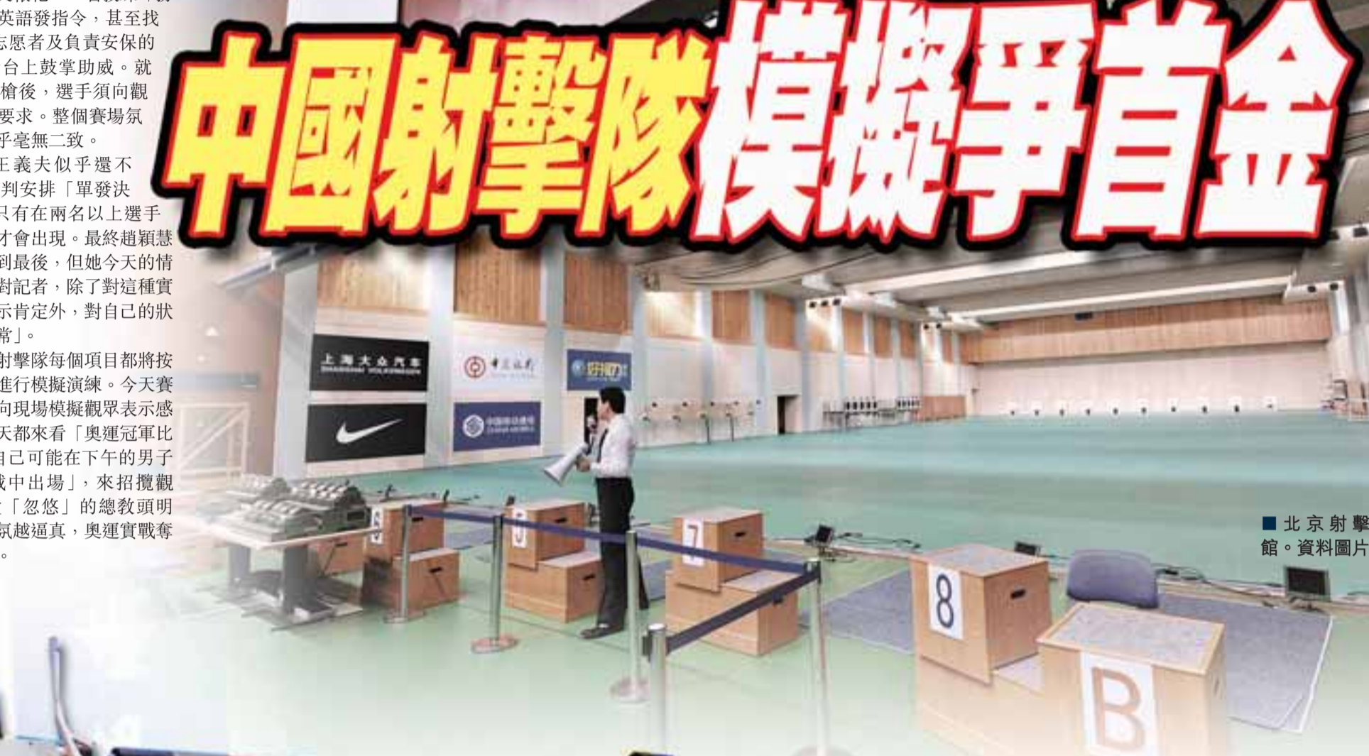
■北京射擊館。資料圖片

的解說員用中英文報靶，一名教練「扮演」現場裁判用英語發指令，甚至找來100多名賽會志願者及負責安保的武警戰士，在看台上鼓掌助威。就連在打完最後一槍後，選手須向觀眾揮手致意都有要求。整個賽場氛圍與奧運實戰幾乎毫無二致。