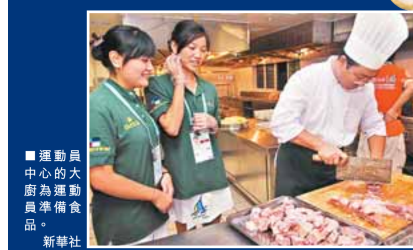
■運動員中心的大廚為運動員準備食品。

距第29屆奧運會開幕 還有 58天 二〇〇八年六月十一日 (星期三) 戊子年五月初八 http://www.wenweipo.com