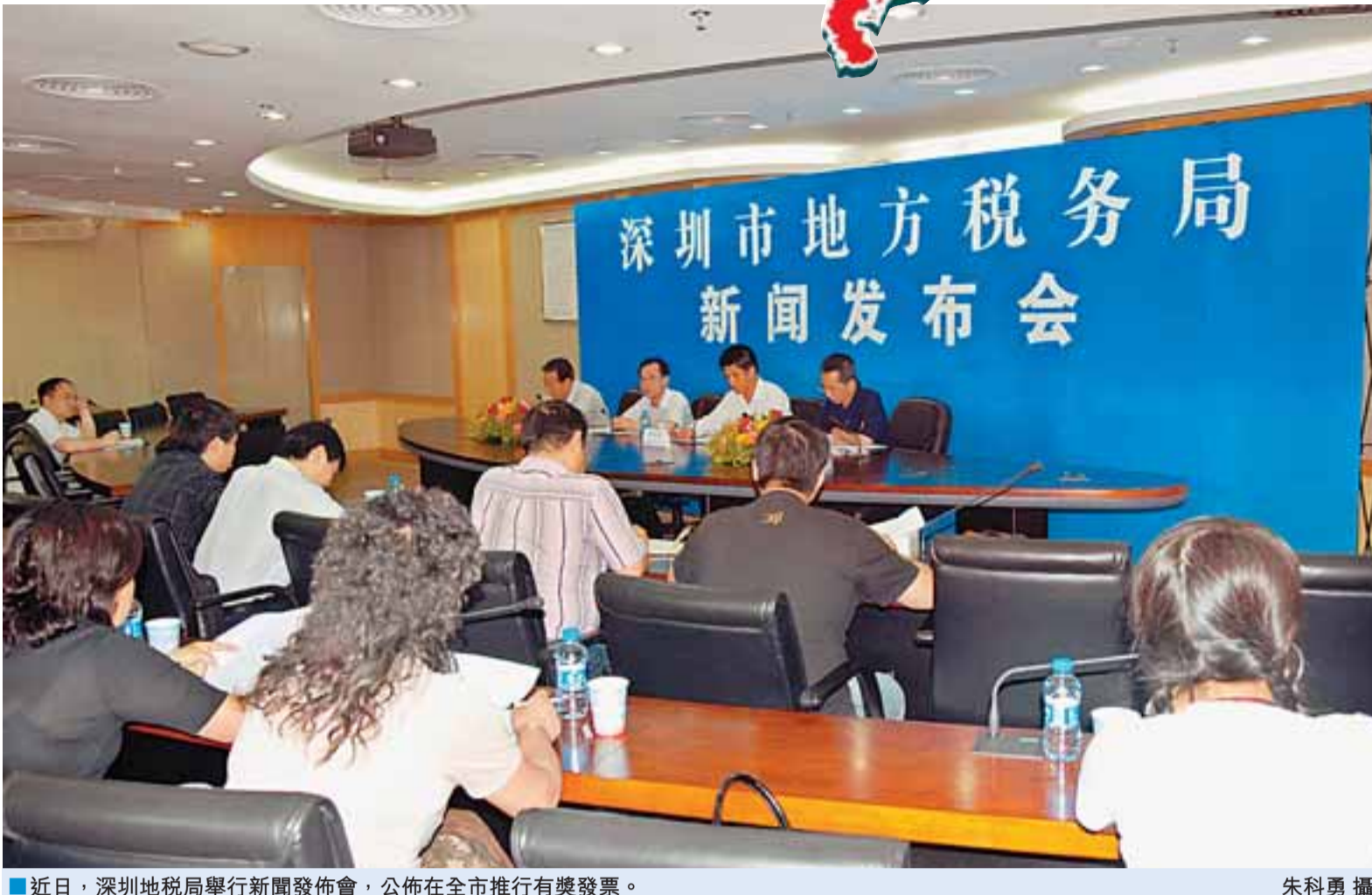
■近日，深圳地稅局舉行新聞發布會，公佈在全市推行有獎發票。

港人今後在深圳消費應該留意索要發票。為鼓勵消費者在深圳消費時及時主動索取發票，依法維護自身權益，深圳市地稅局決定從5月20日起在全市飲食業和娛樂業全面推行10元以上的有獎發票，最高獎金可獲得3,000元，單張有獎發票的中獎率不低於1%，且小面額的發票也有可能中大獎，這是深圳首次推行有獎發票。