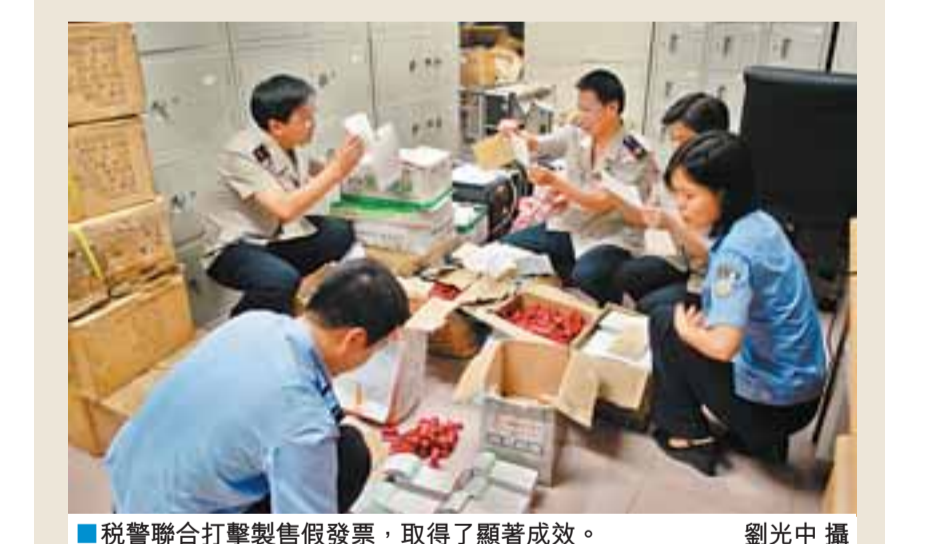
■稅警聯合打擊製售假發票，取得了顯著成效。

深圳地稅情繫災區捐款逾300萬 四川省汶川發生8.0級大地震的災情，牽動着深圳特區地稅人的心。災情發生後，全系統員工發揚「一方有難，八方支援」的精神，踴躍參加捐款，向災區奉獻愛心。據統計，截止5月23日，全系統376名幹部職工、臨時人員和離退休幹部共向災區捐款3522140元，其中，全局1123名黨員繳納「特殊黨費」1305465元，深切表達了特區地稅人對災區人民血濃於水的真情。 設20個賑災捐款點 四川汶川發生大地震後，在外出差的深圳地稅局局長及專職及臨時工作部，立即打電話給在深的局領導，要求迅速組織全系統幹部職工開展捐款救災行動，並帶頭捐款。市局分管局領導當天下午迅速召開開關會議，研究部署賑災捐款工作，要求統一思想、統一行動。按照市局部署，經過各級領導廣泛深入地宣傳和層層發動，全系統設立20個賑災捐款點，5月14日上午就收到3210名幹部職工的捐款共1045278元，當天下午就通過深圳市慈善會賑災捐款專賬賬戶，第一時間向四川汶川災區伸出深圳地稅人的援助之手，幫助災區渡過難關。 隨着抗災救災的不斷深入，深圳地稅愛心持續湧動，捐款不斷。5月20日局領導再次向全系統員工發出倡議，舉行了「捐贈兩天收入」的捐款活動。此外，全局還組織部分幹部職工參加了抗災救災義務獻血活動。