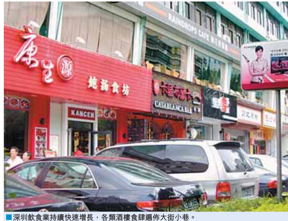
■深圳飲食業持續快速增長，各類酒樓食肆遍佈大街小巷。

港人今後在深圳消費應該留意索要發票。為鼓勵消費者在深圳消費時及時主動索取發票，依法維護自身權益，深圳市地稅局決定從5月20日起在全市飲食業和娛樂業全面推行10元以上的有獎發票，最高獎金可獲得3,000元，單張有獎發票的中獎率不低於1%，且小面額的發票也有可能中大獎，這是深圳首次推行有獎發票。