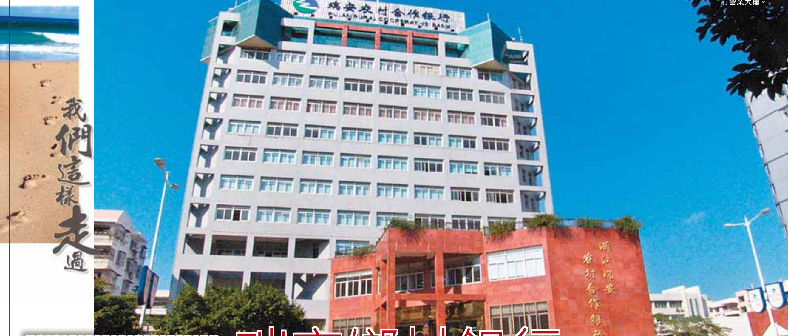
瑞安農村合作銀行營業大樓。