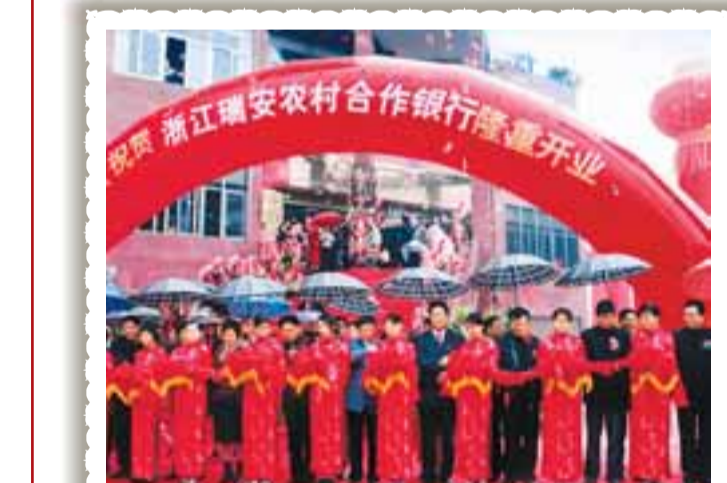
■浙江瑞安農村合作銀行開業典禮現場。