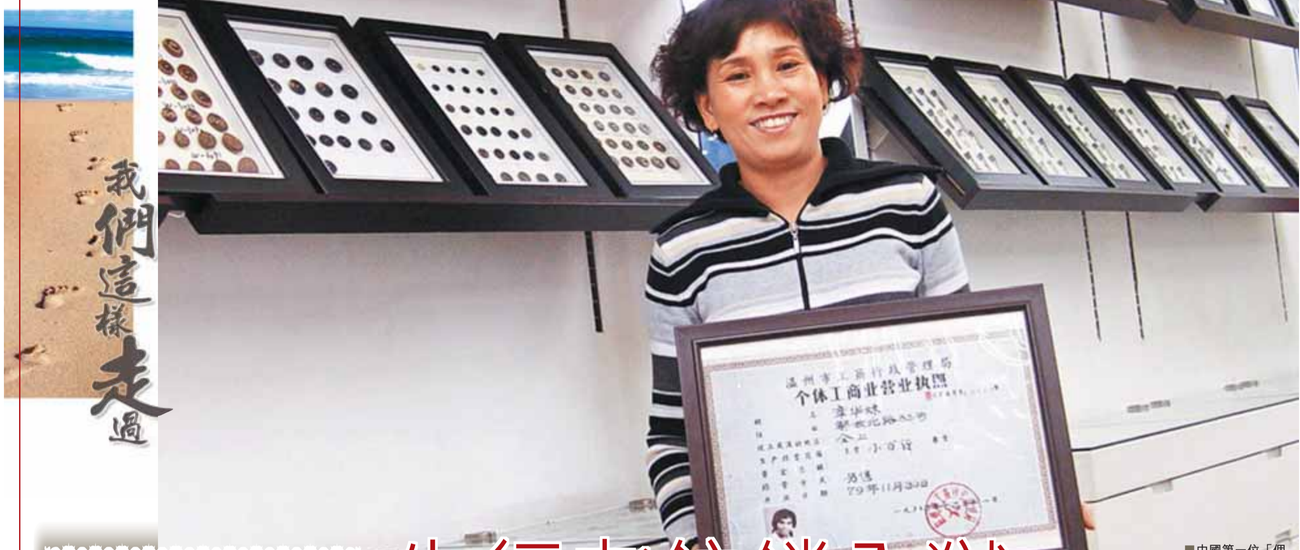
中國第一位「個體戶」章華妹。