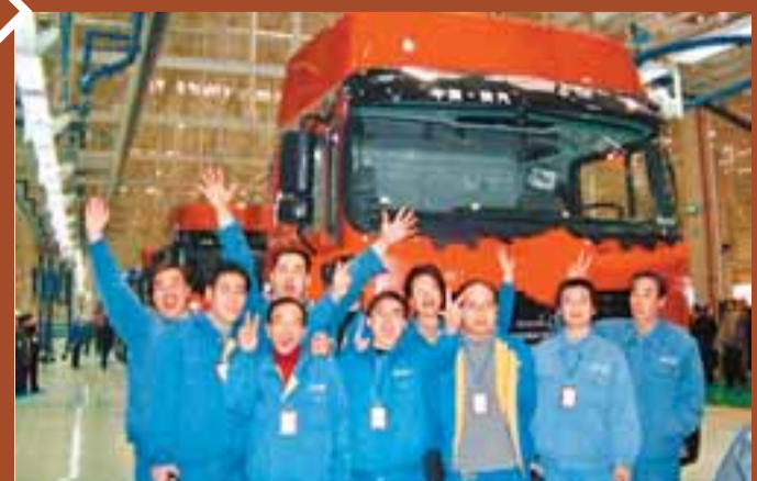
■陝汽集團職工在首輛下線的車型卡車前歡呼留影。