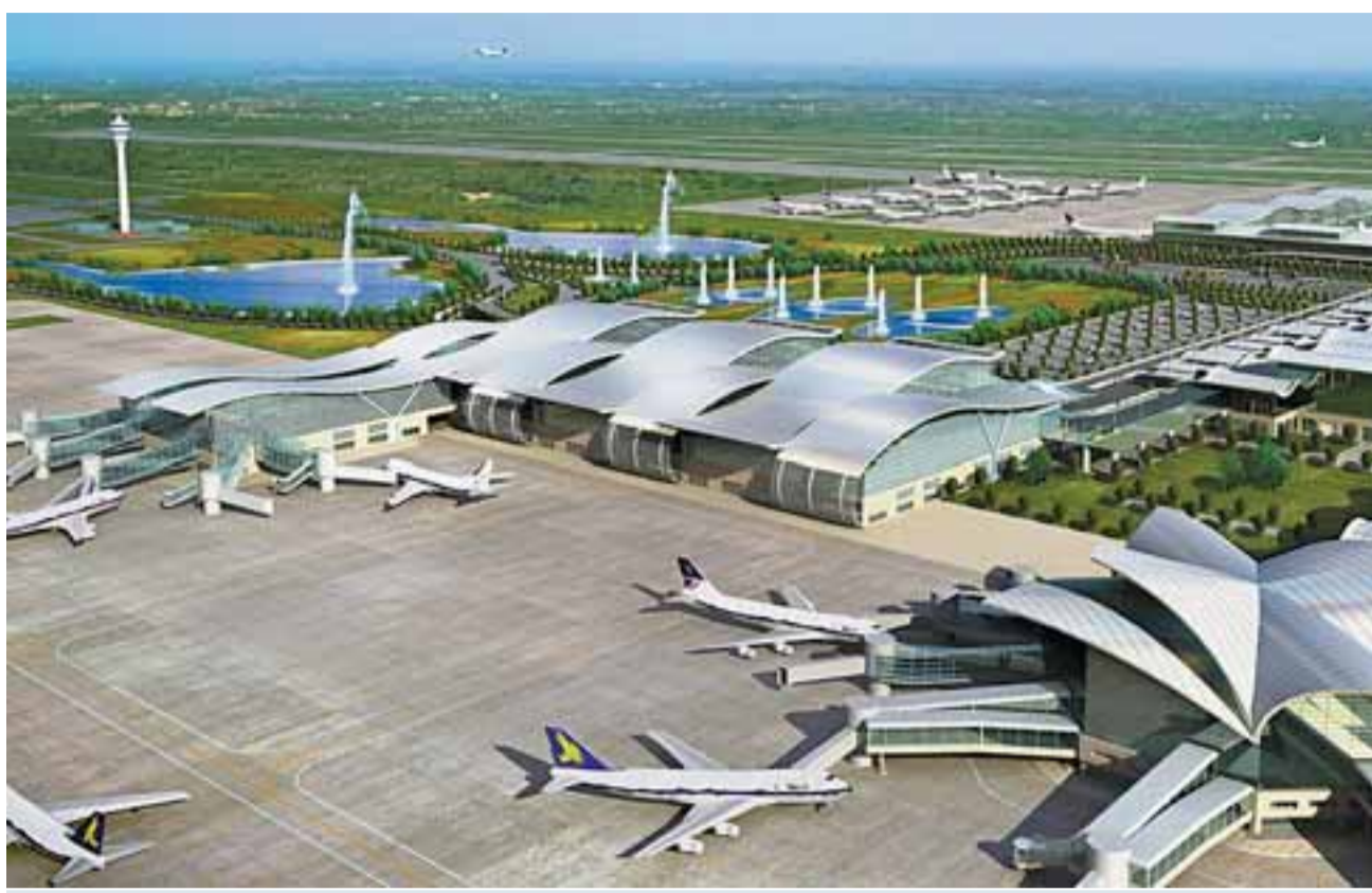
總部設在杭州的錢塘航空，將以杭州蕭山國際機場為基地。圖為與港合資的杭州蕭山國際機場國際航站樓鳥瞰效果圖。

【本報訊】弱留強的航空業競爭激烈，而由4位浙江義烏的民營企業家投資籌建的錢塘航空公司卻迅速成長。據悉，錢塘航空和擴建中的蕭山國際機場已經與法國航空公司組建了關於開通杭州——巴黎航線的聯席工作小組，如果成功開通，錢塘航空將成為內地第一個開通國際航班的民營航空公司。 ■本報駐浙江實習記者 駱曉亦