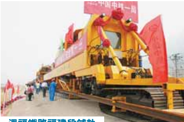
溫福鐵路福建段鋪軌 3日上午，溫(溫州)福(福州)鐵路福建段開始鋪軌。溫福鐵路是中國中長期規劃「四縱四橫」鐵路客運專線之一，全長298.4公里，投資概算174.8億元，預計將於2009年建成通車。 屆時福州至上海的列車運行時間將從現在的14小時25分鐘縮短至5小時左右。它將構成閩、浙兩省間便捷的運輸通道，大大縮短兩省之間以及與上海方向的運輸距離和時間。根據計劃，溫福鐵路福建段鋪軌工程將於2008年底全線貫通。