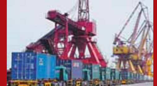
■港口物流是海口重點發展產業之一。