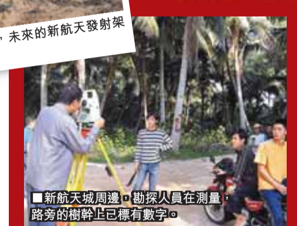
■新航天城周邊勘探人員在測量路旁的樹幹上已標有數字。