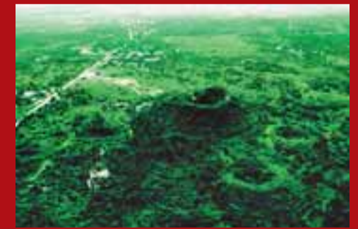
■海口火山口世界地質公園是珍貴的自然奇觀。