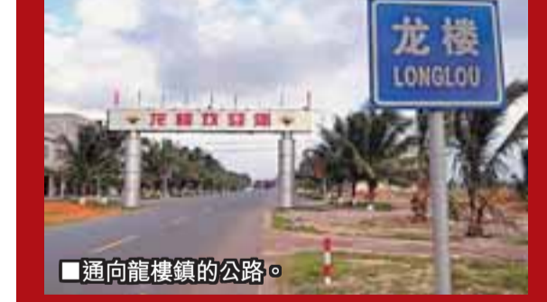
■通向龍樓鎮的公路。