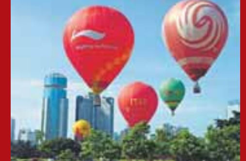
■五彩繽紛的熱氣球，讓海口的天空更亮麗。