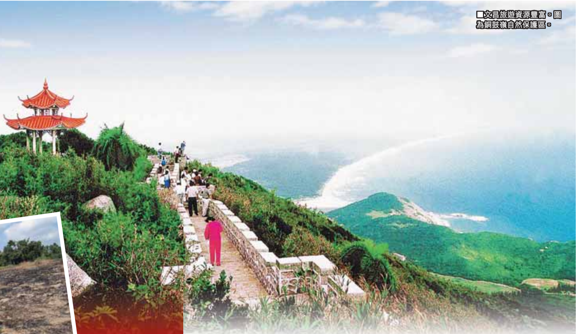
■文昌旅遊資源豐富。圖為鎮欖嶺自然保護區。