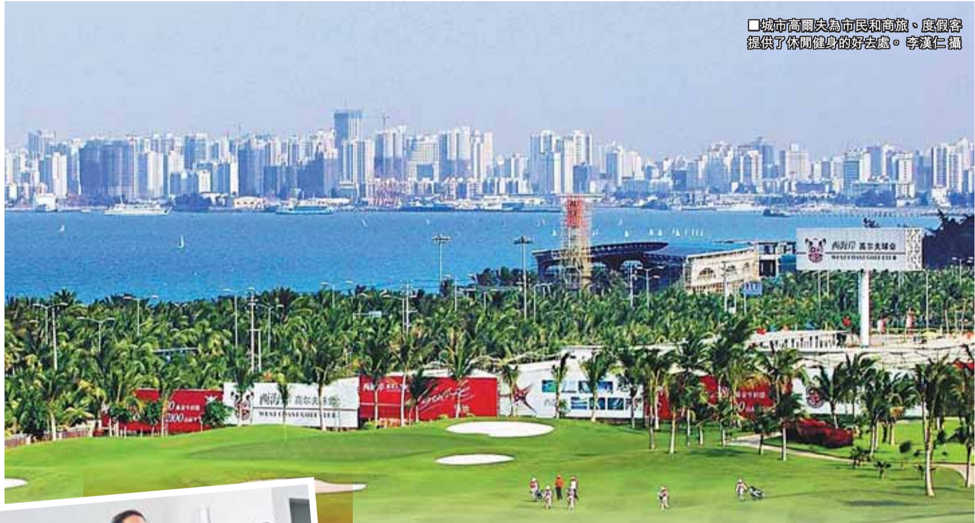
■城市高層為市民和高旅、度假者提供了休閒健身的好去處。