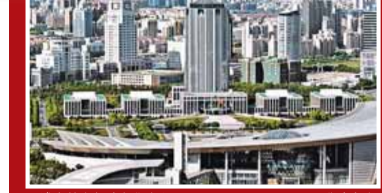
浦東花木行政文化中心。