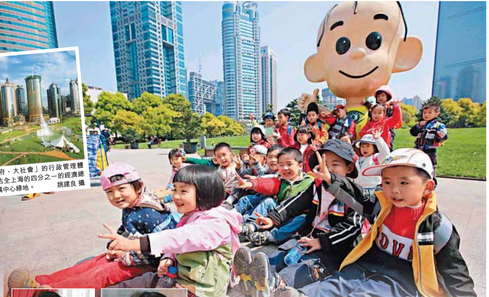
浦東開發18年，實現了「滄海桑田」式的變遷。現代化國際新區在黃海之濱崛起。圖為浦東新一代在陸家嘴中心綠地嬉戲。