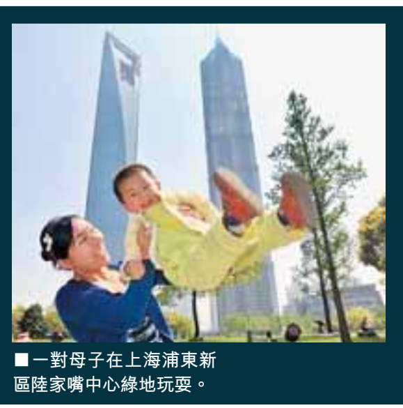
一對母子在上海浦東新區陸家嘴中心綠地玩耍。

「抓緊浦東開發，不要動搖，一直到建成。」這塊矗立在浦東陸家嘴核心區域的大樓牌，是決心亦是信心，見證浦東18年，也指出她未來發展方向。