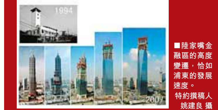
陸家嘴金融區的高度變遷，恰如浦東的發展速度。