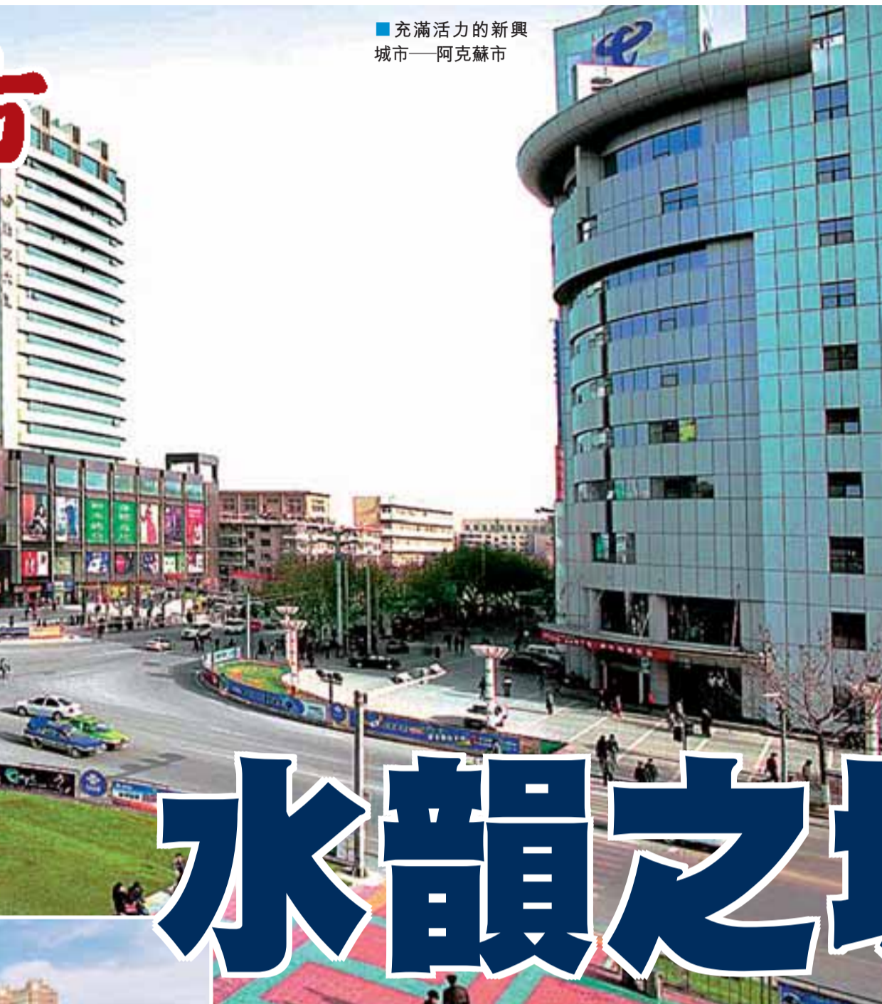
■充滿活力的新興城市——阿克蘇市

之鄉，「香梨原產地」，香梨獲世博會金獎。按照「十一屆」規劃，阿克蘇市正打造「中國農園」品牌，重點發展紅棗和核桃產業，計劃用5年時間使紅棗和核桃在現有30萬畝、68萬畝的基礎上分別發展到150萬畝和100萬畝，力爭建成全國優質名牌紅棗、核桃基地。