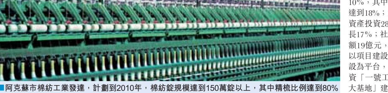
■阿克蘇市棉紡工業發達，計劃到2010年，棉紡錠規模達到150萬錠以上，其中精梳比例達到80%以上，阿克蘇輕紡初具雛形。圖為蓬勃發展的棉紡業。

阿克蘇市按照「一中心三星」城市發展規劃，以多浪河景觀帶改造和「四城」同創為契機，全力推進城市大改造、大建設、大管理，「水韻之城、森林城市」建設成效顯著。在總結多浪河景觀帶拆遷經驗的基礎上，順利啟動了香港街片區、東城校區片區等舊城區改造項目，水韻明珠、金橋現代城、迎賓大廈等一批新興商品住宅樓群和環保節水小區陸續建成，市民居住環境進一步改善。改擴建交通路、英阿瓦提西路等7條城市主幹