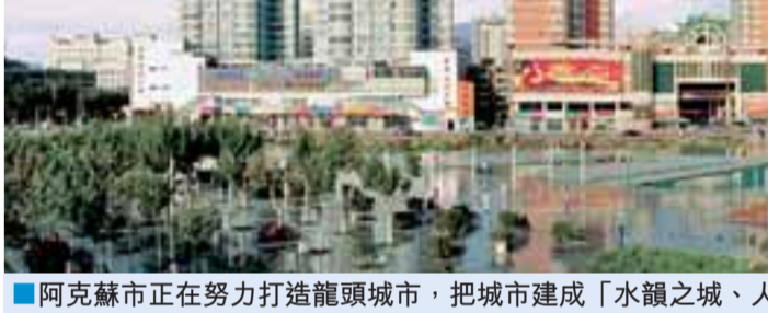
■阿克蘇市正在努力打造龍頭城市，把城市建成「水韻之城、人居最佳」的西部明珠。

這是一片神奇的土地，這是一片希望的沃土，我們誠邀更多的有識之士開發建設阿克蘇，共同收穫成功的碩果。