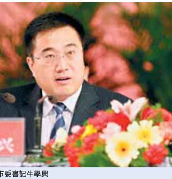
■中共阿克蘇市委書記牛學興

實現地方生產總值56.3億元，同比增長14%；財政收入達到6.38億元，同比增長10%，其中：一般預算收入達到18%；完成全社會固定資產投資28.6億元，同比增長17%；社會消費品零售總額19億元，同比增長6%。以項目建設為抓手，園區建設為平台，大力實施招商引資「一號工程」，推進「八大基地」建設，阿溫經濟隆起帶建設取得進展。全年實