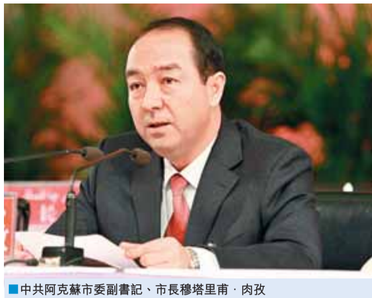
■中共阿克蘇市委副書記、市長穆塔里甫·肉孜

現工業增加值6.9億元，同比增長20.6%。徐礦集團阿克蘇電廠、河南水煤集團60萬噸聚氯乙稀、阿克蘇熱電聯產等一批重大項目洽談成功，簽訂合同；華孚8萬錠紡紗、天海綠洲紅棗深加工二期等重點項目相繼開工、投產；全年完成社會固定資產投資24.48億元，同比增長22.52%，增幅創歷史新高。落實招商引資項目63個，到位資金10.87億元，同比增長36%。編制完成《阿溫聯盟》區域發展戰略規劃並通過了初評，《阿溫聯盟、合作發展》取得進展。