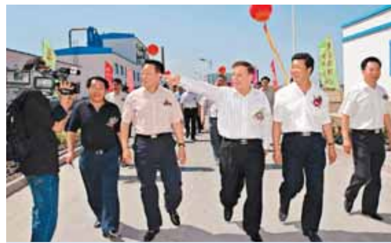
■2007年8月28日，新疆錳錳工業基地一期建設項目投產，原自治區黨委常委、副主委（現自治區人大常委會主任艾力更·依明巴海（中）在袁澤、郭海樂的陪同下視察錳錳工業基地。