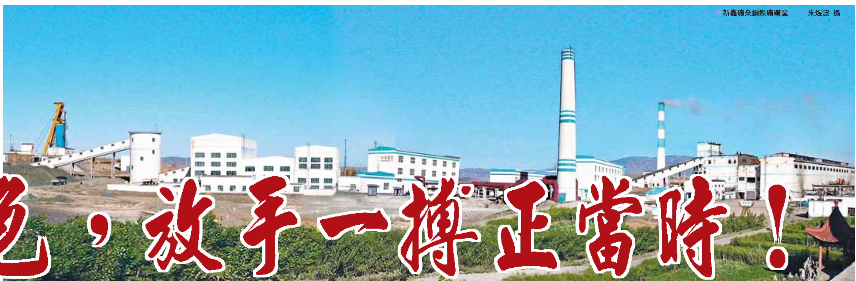
●新鑫礦業銅鑛煉礦區

「對於世界來說，2008年無疑是『中國年』；對於新疆有色集團來說，2008年就是地質找礦『會戰年』、項目建設『突破年』、實現新目標、新跨越的『發展年』。」日前，新當選的全國人大代表，新疆有色集團公司黨委書記、董事長，新疆新鑫礦業股份有限公司董事長袁澤，以他一貫昂揚而充滿力度的聲音給了記者這樣一個令人振奮的開場。他攥緊拳頭有力一揮，繼續說道：「新疆有色，放手一搏正當時！」顯然，袁澤的這種自信與豪邁，來自於他統領的新疆有色集團及其控股的新疆新鑫礦業股份有限公司所面臨的天時、地利、人和。 本報特約記者：朱煜波、本報記者：應江洪、董紅