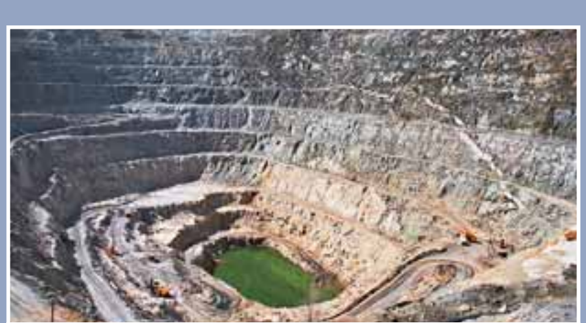
■享譽世界的「地質博物館」、「地質聖坑」——可可托海「三號坑」，已實現復原。