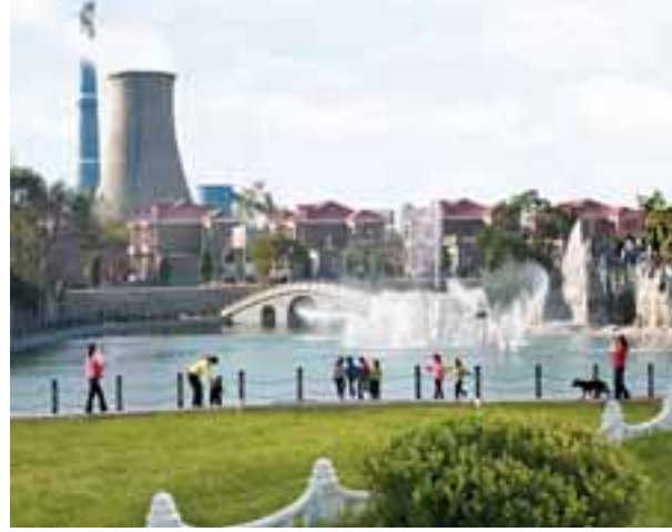
如今常平村充滿綠化的公園成為村民休閒的好去處。

近年來，常平經濟開發區先後建成大型煤氣發電廠，40萬噸焦化廠，千畝農業綜合開發區，200萬噸煉鋼廠，100萬噸國內同行業領先的高速線材廠等大中型企業。此外以合作、入股等多種形式投資5.6億元，在五台縣興建20萬噸煉鐵廠，在沁源縣合資經營6座煤礦和80萬噸焦化廠，在武鄉控股120萬噸的東煜煤礦。2006年，常平經濟開發區實現工業總產值40億元，上繳稅金1.5億元，經省政府和國家發改委審核，躋身於首批經濟開發區行列。