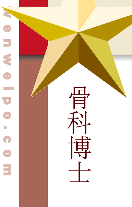
山西全省政協委員