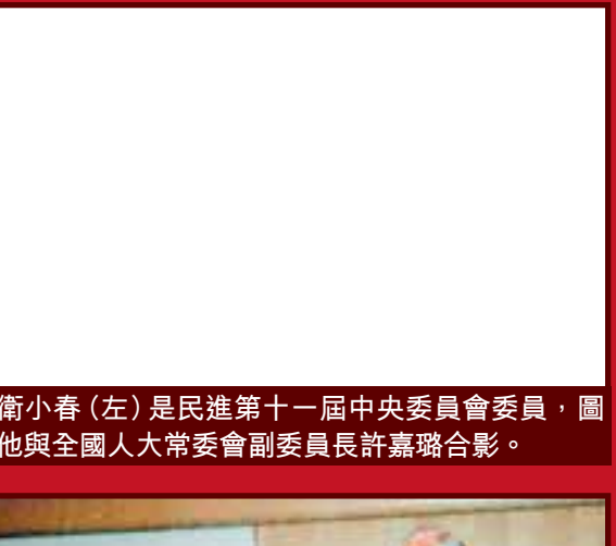
衛小春(左)是民進第十一屆中央委員會委員，圖為他與全國人大常委會副委員長許嘉璐合影。