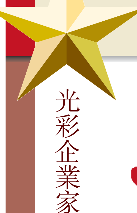
江西全省政協委員