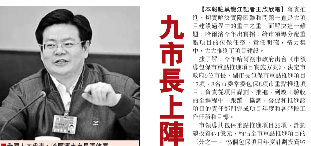
全國人大代表、哈爾濱市長張效廉

張效廉說，當前哈爾濱對俄出口加工區建設面臨主要的問題是資金短缺，土地環保指標不足，加工基地建設進程受到嚴重影響，建議有關部門給予哈爾濱市重點支持和幫助，支持加工基地的發展建設。市領導共包保重點推進項目25項，計劃總投資471億元，約佔全市重點推進項目的三分之一，25個包保項目年度計劃投資97億。在這些項目中，民生項目佔有突出位置，主要有：解決市民住有所居的危舊棚戶區改造一期工程、改善生態環境的何家溝污水截流及河道整治工程、計劃總投資71.5億元，年度計劃投資36.7億元，分別佔25個包保項目的15%和38%。一批上市強省項目，如中煤集團謀劃和推進的3個化工項目，年度計劃投資約為50億元，年度計劃投資6.2億元。商業與物流園區建設主要有哈爾濱南極商貿城等4個項目，計劃總投資44.6億元，年度計劃投資11.1億元。市領導包保全市重點項目，為哈爾濱項目建設起到了示範和帶頭作用。該市各區、縣(市)、開發區等部門，都將建立和完善本地區、本部門推進項目建設的體制和機制，主要領導和領導班子都要包保項目，實行「4X+1」的統籌領導，通過大項目建設，加大固定資產投資力度，促進全市經濟社會發展、大發展。