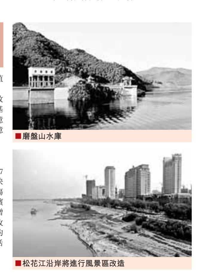
松花江沿岸將進行風景區改造