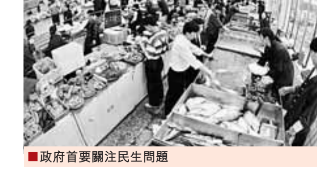
政府首要關注民生問題