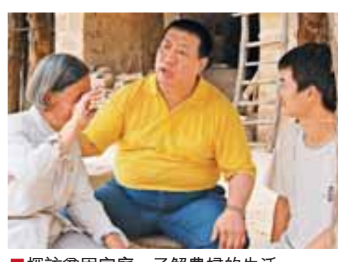
探訪貧困家庭，了解農婦的生活。