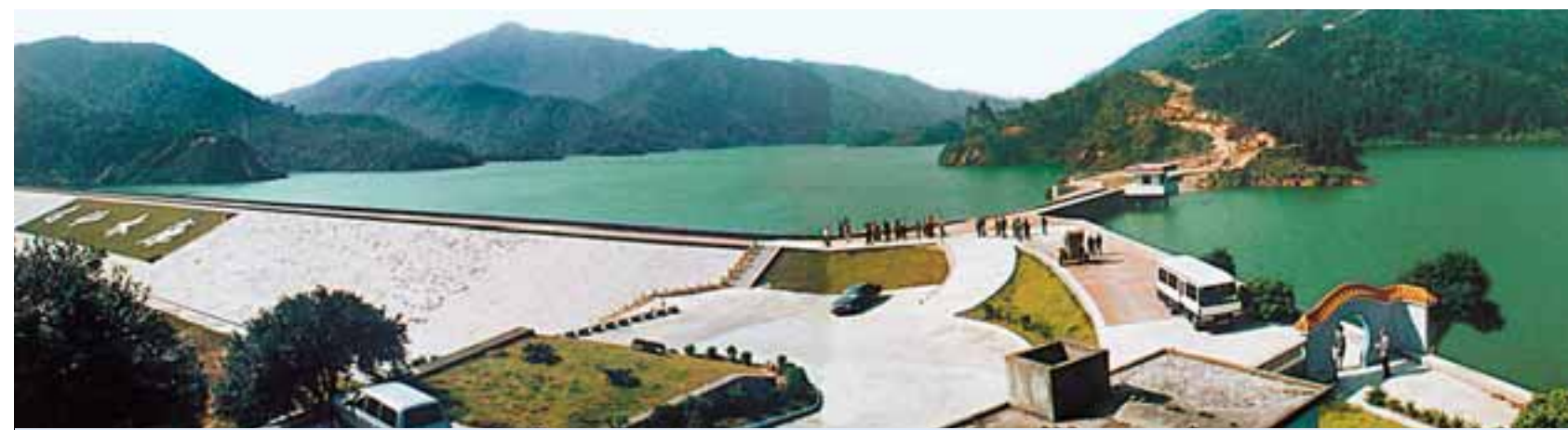
2010年廣東將完成全省病險水庫除險加固工作，做到「除險加固一座、完成一座、竣工驗收一座、發揮效益一座。」

據悉，在工程措施上，廣東將採取「一庫一策」的辦法，強力推行除險加固工作。省水利廳已向省政府建議參照省人大大小小水庫議案的實施辦法對其中的