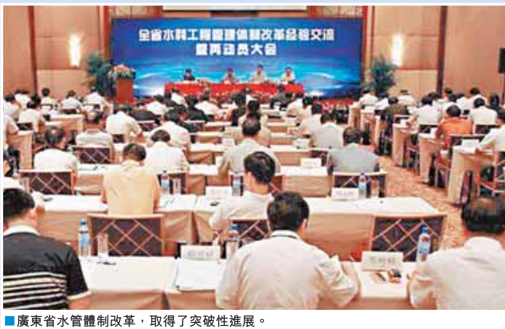
廣東省水管體制改革，取得了突破性進展。