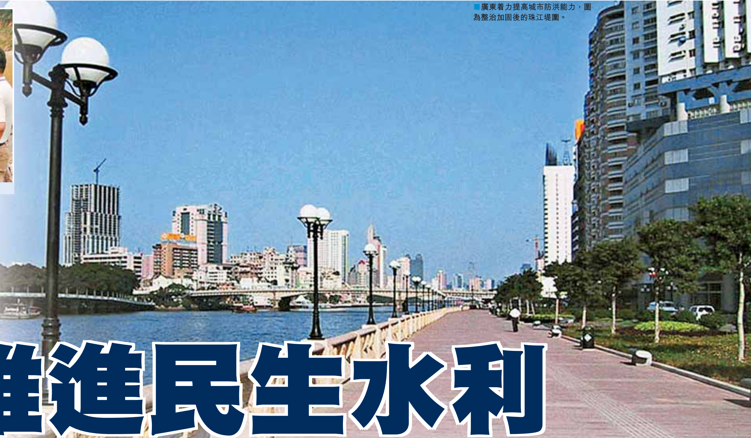
廣東着力提高城市防洪能力，圖為整治加固後的珠江堤圍。

快推進全省6個具有代表性的灌區試點工作。要求在上半年完成試點項目的前期工作，下半年啟動。三是切實加快三大大型灌區的信息化建設步伐。四是加強灌區續建配套與改造項目建設管理。今年，廣東省發展改革委、財政廳、水利廳將聯合出臺《廣東省灌區續建配套與改造項目建設管理辦法》，重新編制中小型灌區續建配套與改造規劃，進一步加大灌區改造的資金投入，全面規範全省灌區續建配套與改造項目建設管理工作。