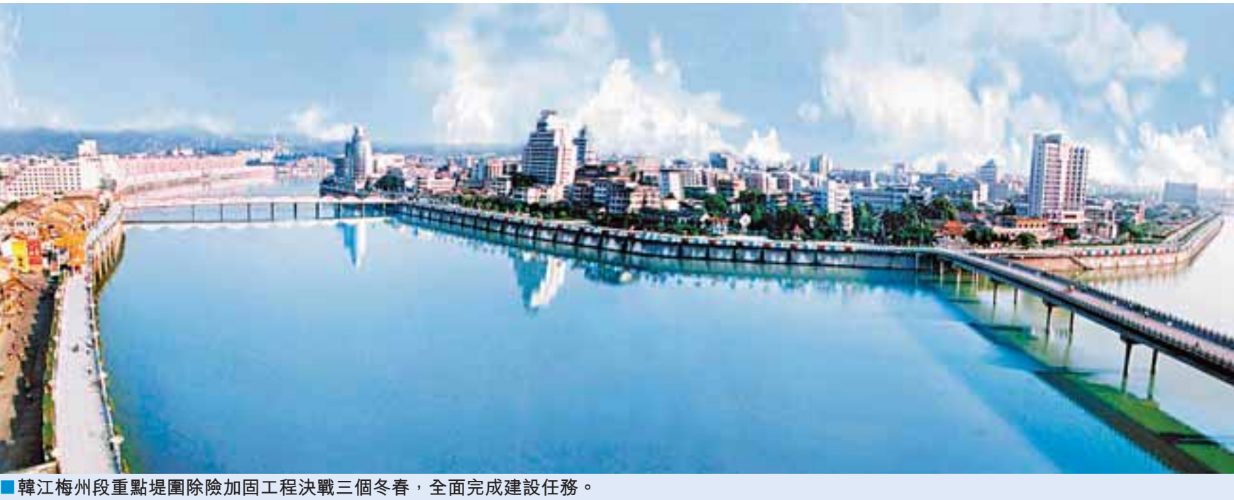
韓江梅州段重點堤圍除險加固工程決戰三個冬春，全面完成建設任務。