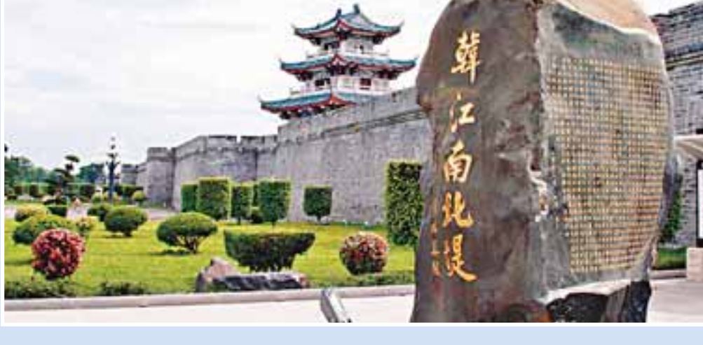
加固後的韓江南北堤保留了古城的原貌

四是全面完成水管體制改革工作。五是農村飲水安全工程要在優先解決涉及199.7萬農戶飲水、含砷和苦鹹水問題的基礎上，完成廣東省農村飲水安全「十一五」規劃的750.8萬農戶的飲水安全問題。六是全面完成病險水庫的除險加固任務。七是實施東江水資源分配方案，並建成水資源監控系統，理順管理體制，實現東江水資源的統一調度和管理。八是完成珠澳供水安全關鍵性水源工程竹銀水庫建設並投入運行，從根本上解決鹹潮對珠澳供水的威脅問題。九是全面完成省三防指揮系統二期工程建設任務，進一步提高廣東省三防指揮決策能力。十是着力解決淡水對湛江經濟和社會發展的制約問題。