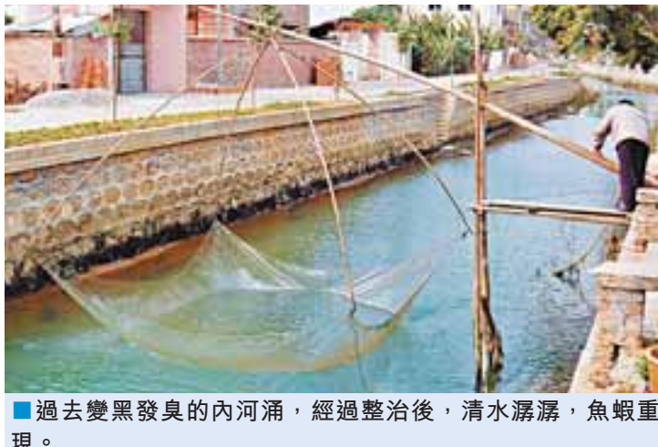
過去變黑發臭的內河涌，經過整治後，清水潺潺，魚蝦重現。