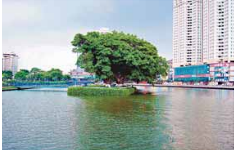
整治後的岐江河，清水潺潺，碧波蕩漾。

水利作為基礎設施，要為全省經濟社會發展提供防洪、供水等安全保障，就必須以科學發展觀為指導，進一步解放思想，以思想的解放、觀念的更新推動水利實現又好又快發展。廣東省水利廳長黃柏青近日在接受記者採訪時表示，廣東大力推進民生水利建設，立足民生、為民而謀，以保障人民群眾生命安全、生活穩定、生產發展、生態改善等基本的水利需求為重點，突出解決好事關廣大群眾切身利益的水利問題，形成保障民生、服務民生、改善民生的水利發展格局，讓廣大群眾共享水利發展成果。 本報記者 余文蓮、通訊員 張繼濤、陳東