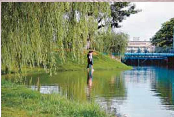
水環境的改善，為市民提供了人與水和諧相處的良好環境。