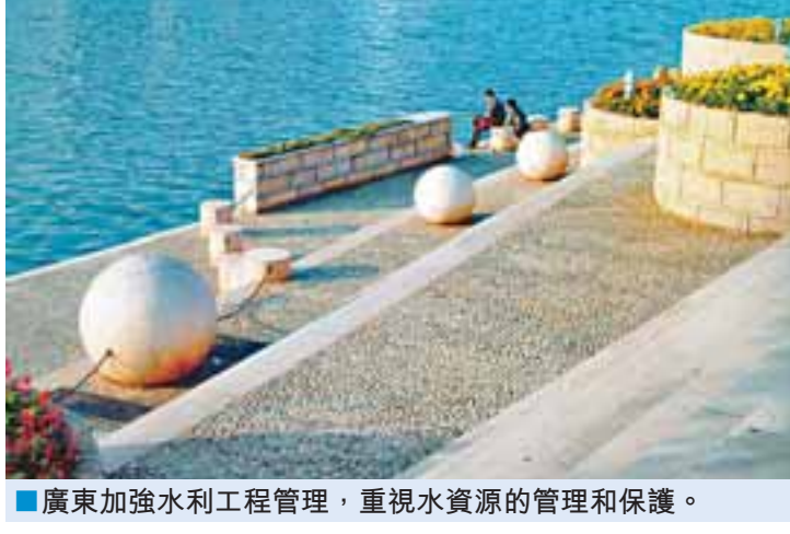
廣東加強水利工程管理，重視水資源的管理和保護。