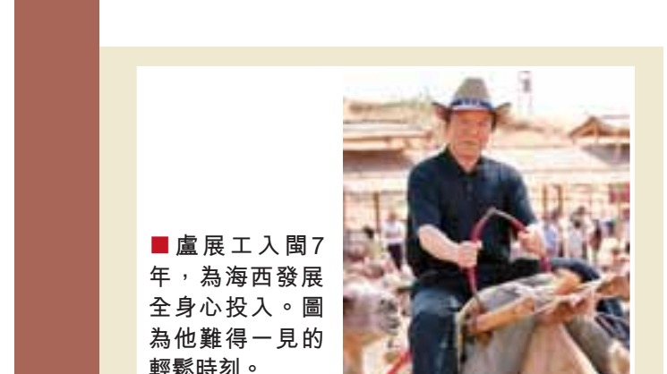
■盧展工入閩7年,為海西發展全身心投入。圖為他難得一見的輕鬆時刻。