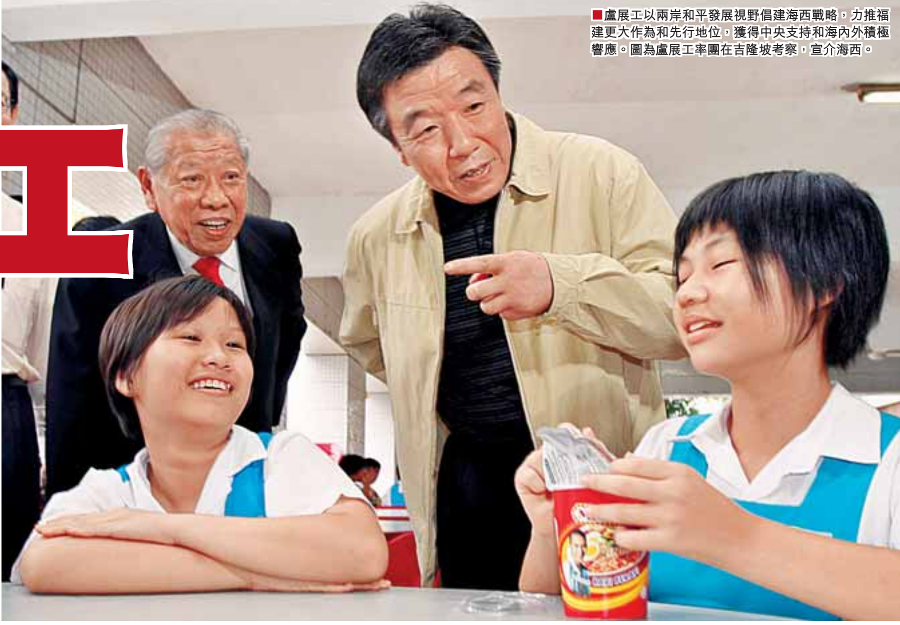
■盧展工以兩岸和平發展視野倡建海西戰略,力推福建更大作為和先行地位,獲得中央支持和海內外積極響應。圖為盧展工率團在吉隆坡考察,宣介海西。

若 時光倒流到7年前,福建人也許不敢想像閩省會以如此快的速度實現新一輪跨越式發展,並重新喚起台商和外商的關注與投資熱情。