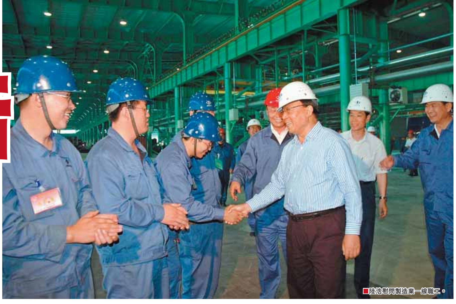
■陸浩慰問製造業一線職工。