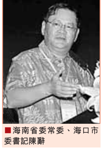
■海南省委常委、海口市委書記陳陳