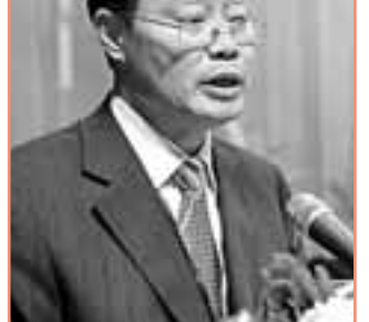
■海口市委副書記、市長徐唐先