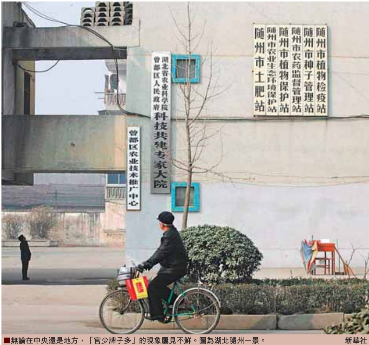
無論在中央還是地方，「官少牌子多」的現象屢見不鮮。圖為湖北隨州一景。