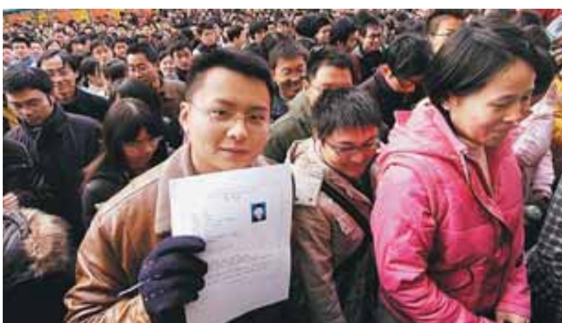
此次機構改革的矛盾並不在冗員，相反一些中央機構人員尚不足。圖為公務員考試。資料圖片

點是在合併職能、整合機構，而不是撤銷職能與機構，更不是精簡人員，也就是減機構不減職能、減機構數量而不減人員。相反，對於一些公共服務部門還要增加人員和編制，加以充實，改變目前工作負荷過大、人員短缺的局面。