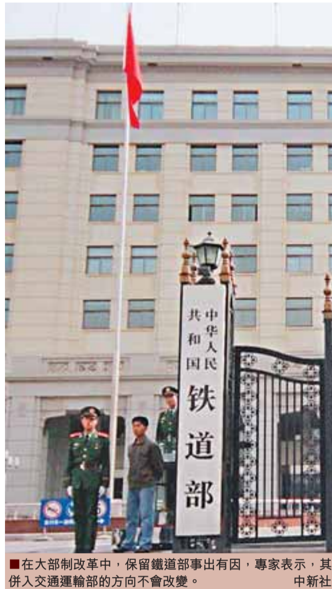
在大部制改革中，保留鐵道部事出有因，專家表示，其併入交通運輸部的方向不會改變。