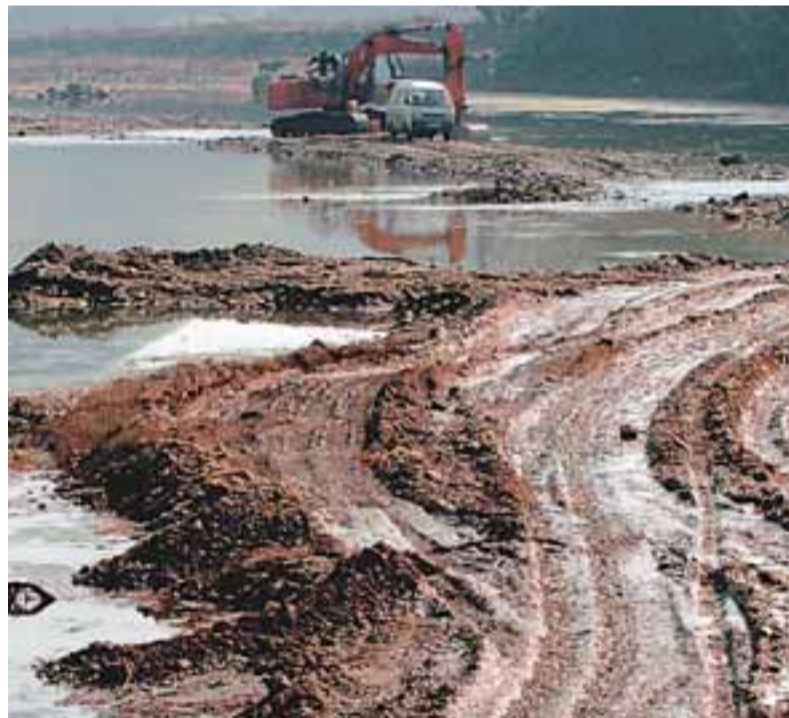
隨着大部制改革推進，地方政府料將在環保、社保等方面獲更大管理空間。

此外，地方政府在財力上將會有所擴大。在公共事務權下放的同時，中央將會擴大地方財權，分稅制、土地財政等制度將會強化，地方財權整體上將有所加強。然而，保持中央政府有足夠的財力是中國政府維持集中式管理體制的重要保障，因此，也不能奢望地方政府的財權會有極大的擴張，更可能的情况是，在財政大餅總量做大的同時，中央與地方共用增長。