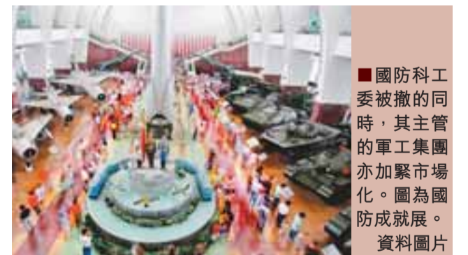
國防科工委被撤銷的同時，其主管的軍工集團亦加緊市場化。圖為國防成展。

【本報兩會報道組北京12日電】按照11日公佈的《國務院機構改革方案》，國防科學技術工業委員會(國防科工委)不再保留。就在國防科工委被撤銷的同時，其主管的十一大軍工集團的市場化進程亦正在提速。