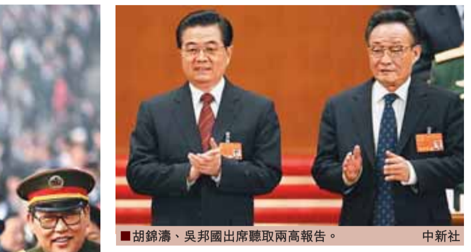
胡錦濤、吳邦國出席聽取兩高報告。