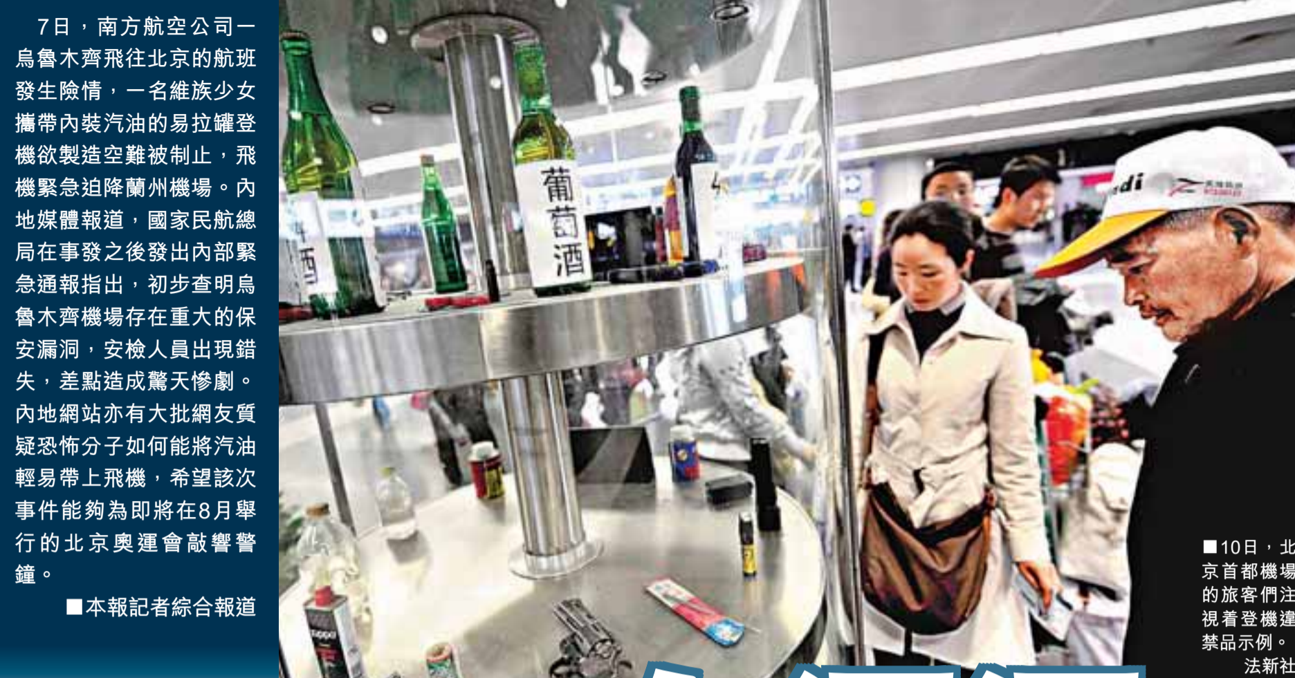
10日,北京首都機場的旅客們注視著登機樓禁止品列。