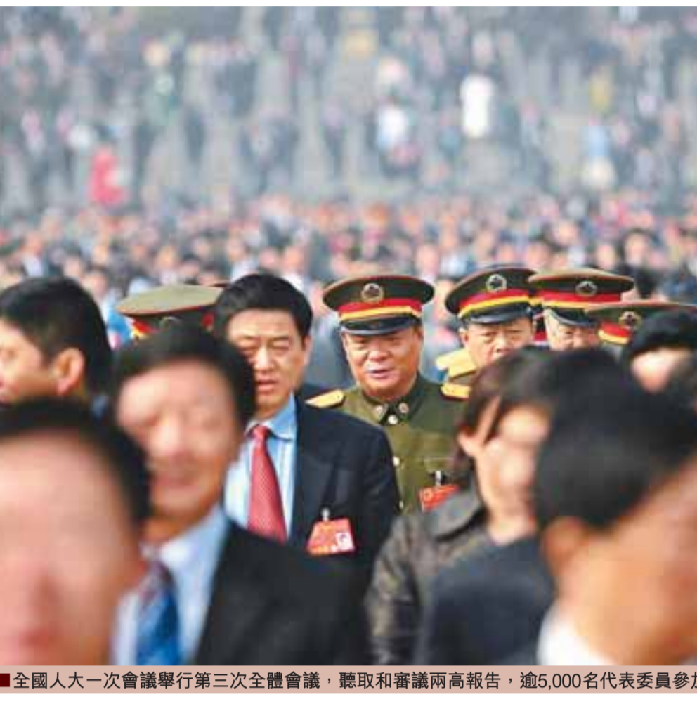
全國人大一次會議舉行第三次全體會議,聽取和審議兩高報告,逾5,000名代表委員參加。