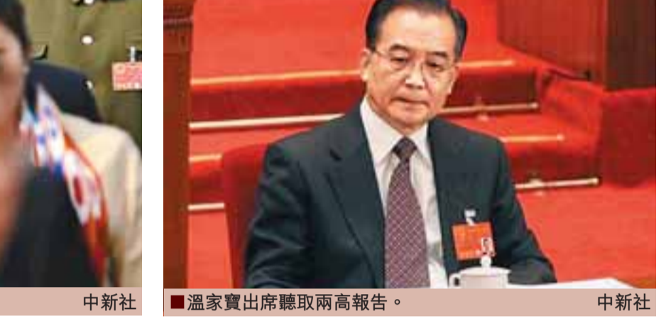
溫家寶出席聽取兩高報告。