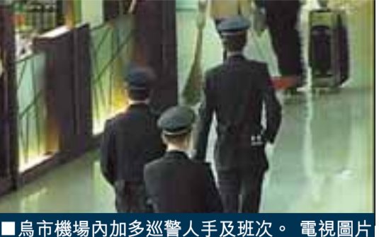
烏市機場內加多巡警人手及班次。電視圖片