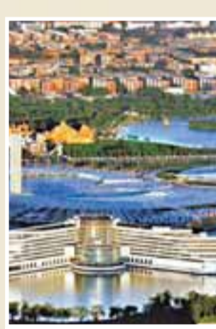
■天津民生和諧，圖為銀河廣場。