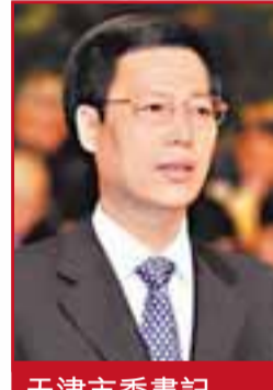
天津市書記 張高麗

生態城充分體現了環保主題，確立「三和」、「三能」發展目標，即：人與人和諧共存、人與經濟活動和諧共存、人與環境和諧共存；能複製、能實行、能推廣。在建設中，生態城將充分運用具有生態特徵的技術手段，突出原生態的修復與恢復，建設生態結構合理、自然功能完善、環境質量優良的自然生態系統和協調的人工環境系統，實現生態環境健康，打通人與自然、人與經濟發展、社會和諧的宜居新城。