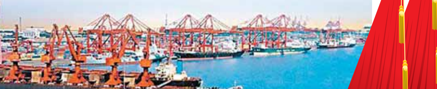
■繁忙的天津港碼頭，成為天津打進濱海新區的獨特優勢。

■科技體制改革方面 與科技部簽訂協議，由濱海新區的海泰公司和中海油集團公司聯合投資開發濱海高新技術產業園區，共同開發電子信息、納米新材料、新能源、生物醫藥等高新技術產業。