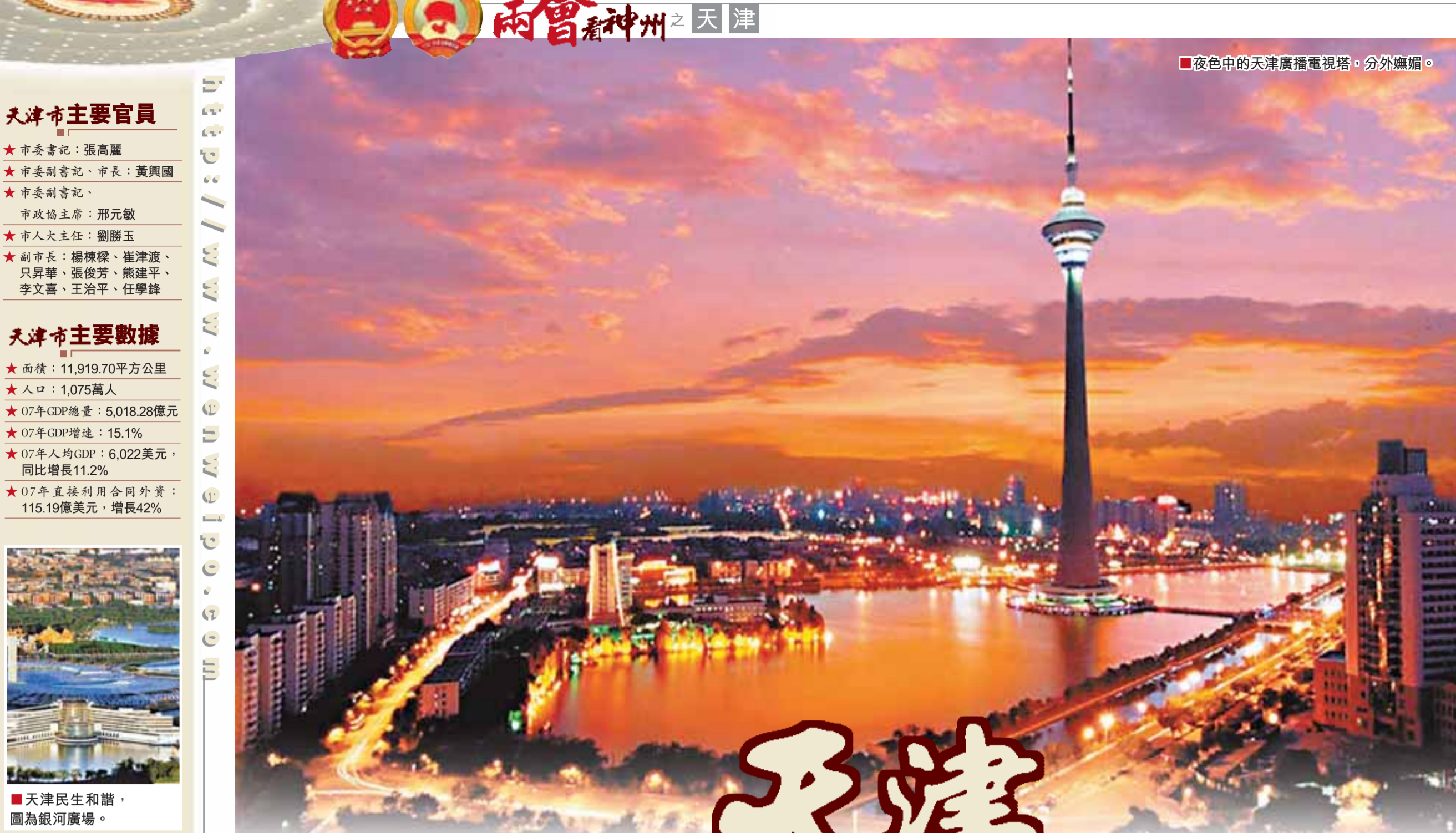
■夜色中的天津廣播電視塔，分外嫵媚。