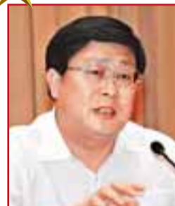
天津市委副書記、市長 黃興國

2007年的最後一天，中共總書記胡錦濤在考察天津時，提出天津要在「兩個方面」走在全國前列，即努力在貫徹落實科學發展觀、推動經濟社會又好又快發展方面走在全國前列，在保障和改善民生、促進社會和諧方面走在全國前列。十七大報告亦進一步明確了加快濱海新區開發開放的國家發展戰略。由於區位優勢明顯，加上國家高度重視，未來天津發展蘊藏巨大機遇，中國經濟新增長極繼續初現。