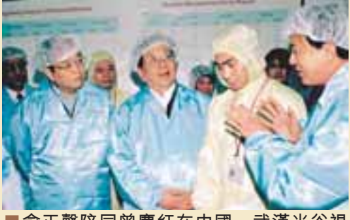
俞正聲陪同曾慶紅在中國·武漢光谷視察高新企業。