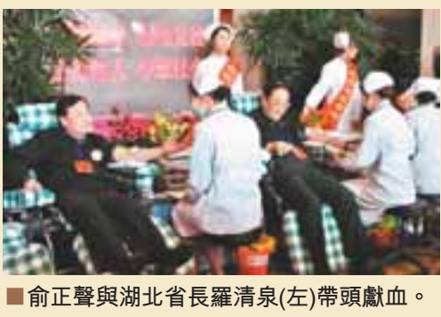
俞正聲與湖北省長羅清泉(左)帶頭獻血。

俞正聲根據數據，指出去年1月至11月間，全國地方財政收入的平均增幅為23%，中部6省除湖南稍遜外，其他各省均輕鬆「出線」；不僅如此，中部地區的平均增速達到26%，而內地率先崛起的東部，地方財政收入增長約為15%；西部則平均為22%——「因此，中部實際上已經在崛起！」