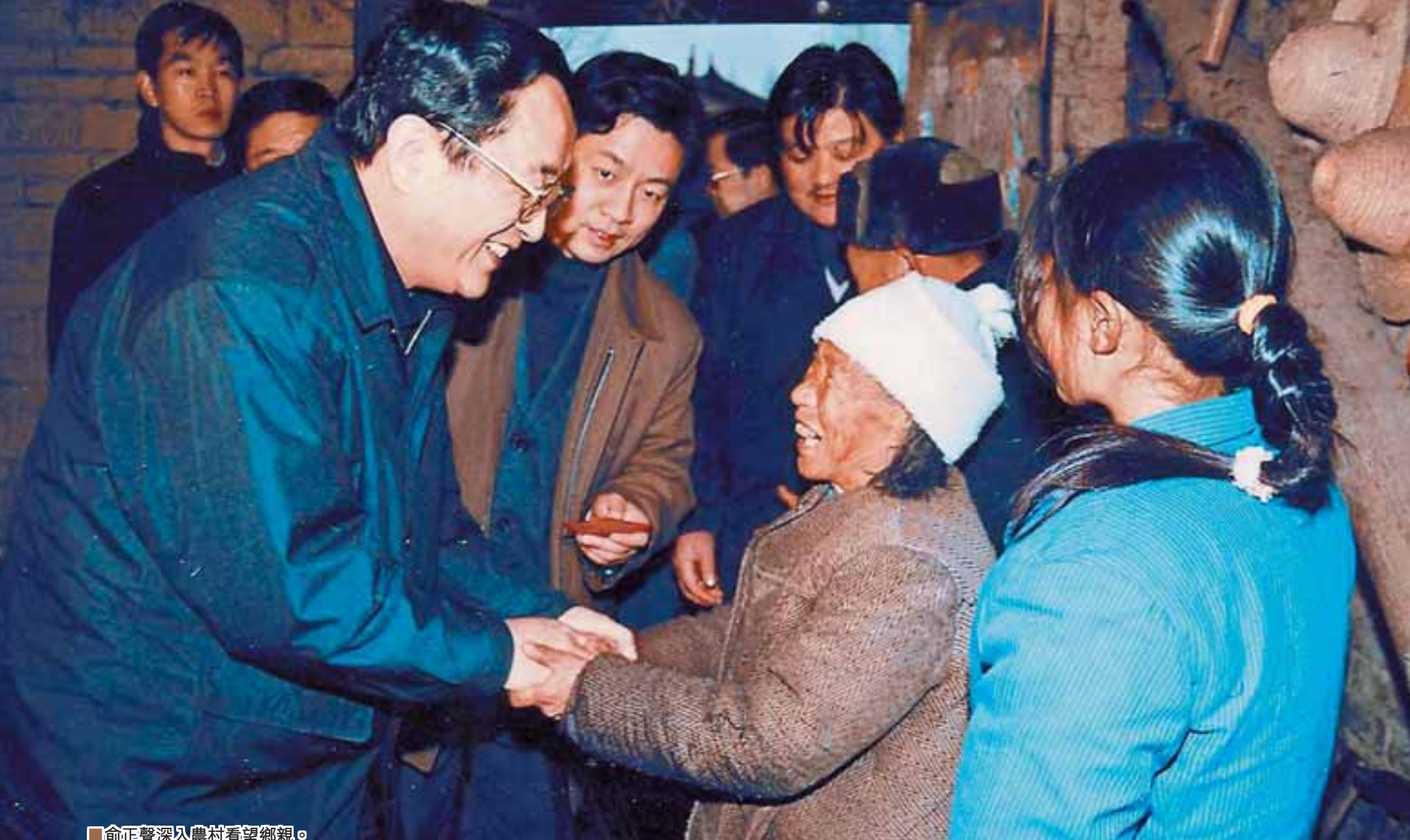
俞正聲深入農村看望鄉親。

俞正聲於2001年就任湖北省委書記，次年成為中部六省省委書記中唯一的中央政治局委員。新官上任，俞正聲即大刀闊斧進行各項改革，砸掉「小金庫」、統一發放津貼、取消特權車、落實省直機關政企分開、禁止省直機關辦報刊等消除幹部的特權思想的舉措迅速在湖北各級官員中引發震動。俞正聲在湖北7年，正是中央促進中部地區崛起戰略從提出到落實的重要時間段，湖北經濟在其治理下發生質的飛躍。 ■本報駐武漢記者 俞龍、鄭銳