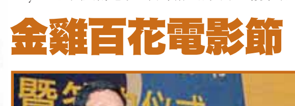
李素妍獲最佳女配角獎。

金雞國際影展 韓國波蘭成大贏家 正在蘇州舉行的金雞百花電影節，其中一個重要部分的金雞國際影展，已於前日閉幕。在今屆國際影展上共有20多部电影參展，競逐該四個獎項。4個獎項中每個獎項均有兩個名額，而韓國女演員獲頒「觀眾最喜歡的外國女演員」，而波蘭及韓國的電影則成為大贏家，分別獲得2個獎項。 這個國際影展的獎項評審團最大的特色之一是，加入了蘇州的影評及電影發燒友與其餘6位專家一同評選得獎電影。 由安東尼爾士憑《The Worlds Fastest Indian》及在評審的3天時間內，各評審亦需要觀看觀眾的群眾調查表來收集推薦名單。 結果西班牙及墨西哥合作拍攝的《Pan's Labyrinth》與越南電影《白絲線》成為了「觀眾最喜歡的外國故事片」的贏家。 而在韓片《我的完美生活》中擔任女主角的李素妍(見圖)則獲得「觀眾最喜歡的外國女演員」，而來自韓國的執導《我人生中最美的一周》的尹濟均則獲得「觀眾最喜歡的外國導演」。 波蘭電影《薩維爾廣場》及《Ja wam pokaze》則獲得「觀眾最喜歡的外國導演」及「觀眾最喜歡的外國女演員」兩獎。 由安東尼爾士憑《The Worlds Fastest Indian》及在評審的3天時間內，各評審亦需要觀看觀眾的群眾調查表來收集推薦名單。 結果西班牙及墨西哥合作拍攝的《Pan's Labyrinth》與越南電影《白絲線》成為了「觀眾最喜歡的外國故事片」的贏家。