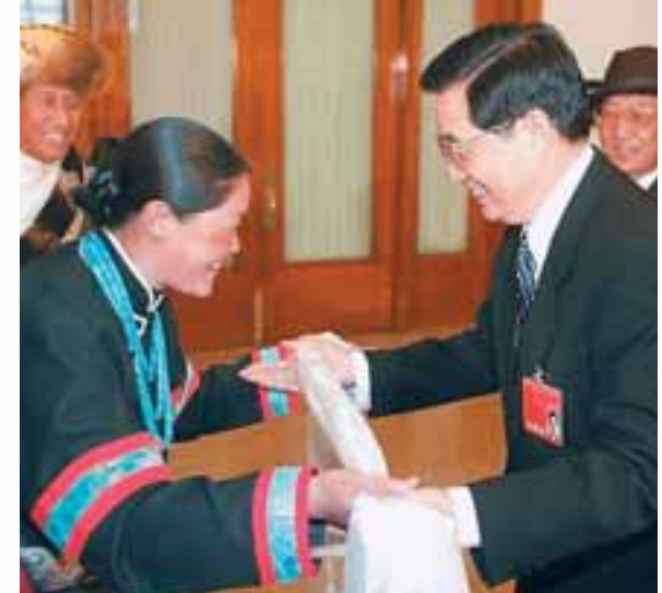
■2003年3月，西藏人大代表向胡錦濤敬獻哈達。