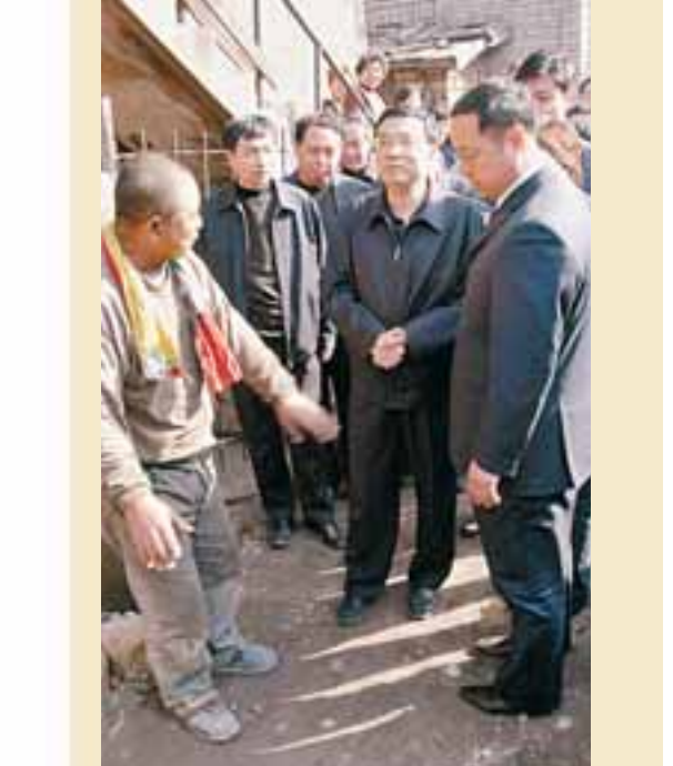
■李克強冒雪嚴寒，探訪莫地溝棚戶區的群眾。