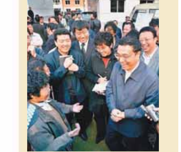
■2005年11月3日，李克強第三次來到莫地溝，如今的莫地溝已經建成現代化的居民小區。

常探訪弱勢社群 嚴謹清廉傳佳話 李克強常常教育官員，要紮實做事、清白為官，「要守得住清貧，耐得住寂寞，慎初、慎微、慎獨，慎欲，努力做到一身正氣，兩袖清風。」 在遼寧，李克強身邊的工作人員告訴記者，李克強書記從不在周末找官員開會、研究工作，他總能把繁瑣繁忙的工作安排得有條不紊；他從不高聲呵斥官員，不管遇到多麼複雜的事，他都會攬事負責、講道理，糾正錯誤，指出改進工作的方法；他講話一向嚴謹，涉及全省經濟發展、特別是民生問題的數據，他都深深記在腦海裡，幾十分鐘的講話常引用大量數據而無需備稿，且少有差錯。 坐床頭拉家常 為民分憂解愁。李克強常常深入到最困難的群眾中去，坐在床頭、炕頭上與群眾拉家常，了解他們的困難和訴求。從棚戶區改造到農村醫保改革，從農村義務教育到零就業家庭再就業，每一項涉及民生的重大決策，都有他調研走訪的足跡；到兒童福利院，他把剛動完手術的唇裂患兒抱在懷裡，叮囑工作人員要像照顧子女一樣照顧患兒，注意發掘孩子各方面的潛能，為他們的成長打好基礎。