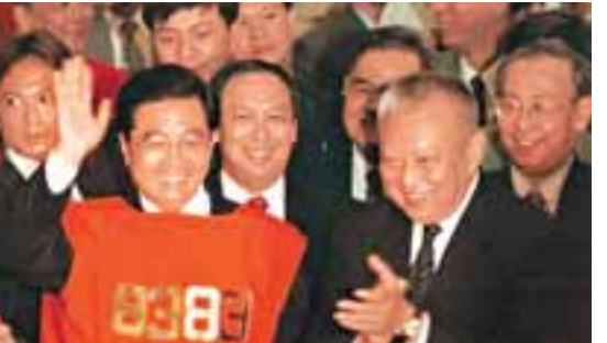
■1999年，時任國家副主席的胡錦濤蒞臨香江，在參觀香港聯合交易所時身穿經紀紅馬甲向眾人致意。

今年7月，胡錦濤在香港回歸十周年之際重臨香江，並走入尋常百姓家，在馬鞍山錦雲苑與趙錫明一家人交談。