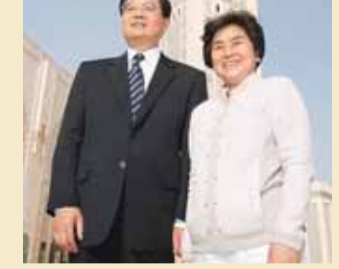
■胡錦濤與夫人劉永清06年4月訪問摩洛哥時合影。

據稱，劉永清是胡錦濤清華大學水利系五九級的同學。劉永清當年進入北京清華大學就讀時，跟胡錦濤同樣是班上年紀最小的學生。胡錦濤在校期間成績優異，又多才多藝，舞蹈唱歌樣樣出色，還擔任過清華大學學生文工團的團支部書記，因而得到了外形亮麗的劉永清的青睞。兩人經過一番愛情長跑，最終結為連理。胡錦濤性情平和、溫文儒雅，劉永清也有同樣的個性和處世原則。夫唱婦隨、低調的生活作風向為人稱道。胡錦濤出任黨和國家領導人之後，出國訪問機會大增，劉永清也頻繁亮相於世人面前。接近劉永清的人說，對作風十分平民化，每次出現在公眾場合，都顯得相當溫和輕鬆。