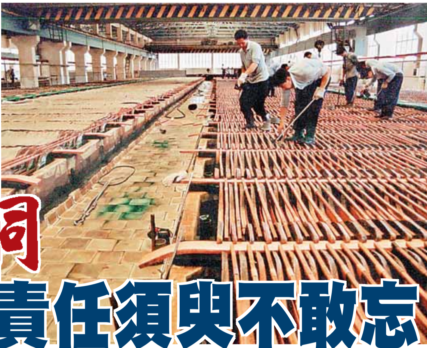
雲銅股份電解銅車間。