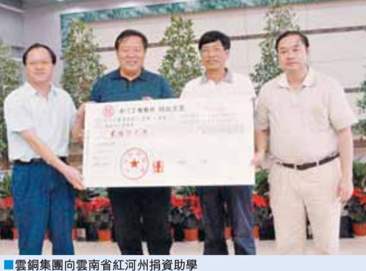
雲銅集團向雲南省紅河州捐資助學