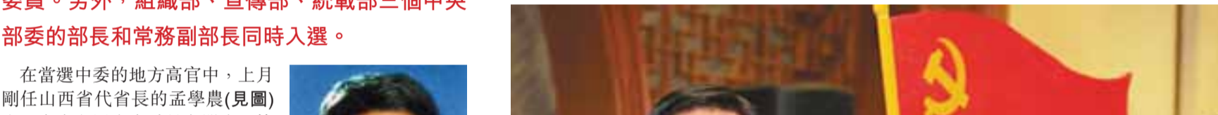
中國核工業集團公司總經理陳日新(中)當選新一屆中委，中海油總經理傅成玉(右)、中國化工集團公司總經理劉德樹(左)表示祝賀。