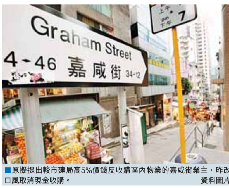
原擬提出較市建局高5%價錢反收購區內物業的嘉咸街業主，昨改口風取消現金收購。