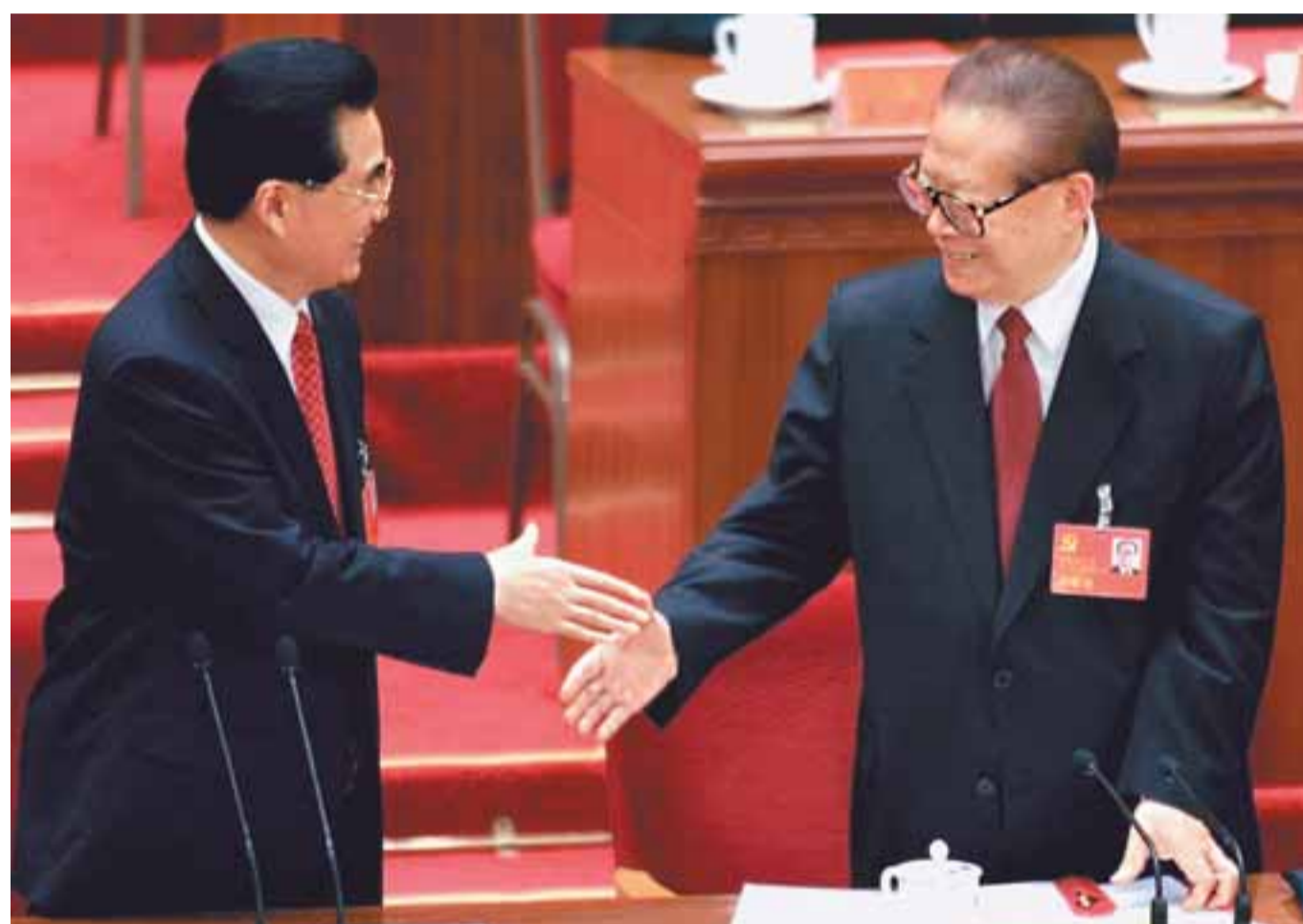
胡錦濤在會議結束後與江澤民握手。