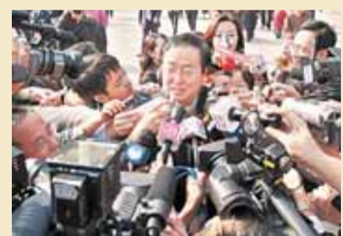
周小川在人民大會堂外被大批記者包圍。

【本報十七大報道組北京21日電】中國人民銀行行長周小川今天(21日)會議剛一閉幕，就遭到了中外記者的圍追堵截，問題源源而來，令好脾氣的周小川不得不撥開記者大步「逃脫」。在人民大會堂外的廣場上，蜂擁而來的記者們隨着周小川，跑出了一個大大的S形。