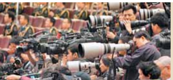
中外記者在十七大閉幕式現場採訪。

據介紹，此次從各個單位抽調過來的翻譯組成員，主要由蒙古族、藏族、維吾爾族、哈薩克族、朝鮮族、彝族、壯族等十幾種少數民族語言成員組成。他們都具有紮實語言功底和豐富工作經驗，確保同聲翻譯時「準確、及時、流暢」。