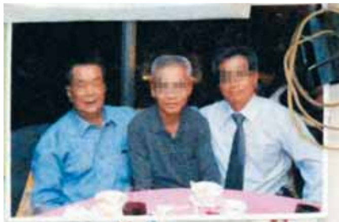
被送院燒傷衣服致受傷的左孫(左)生活照。