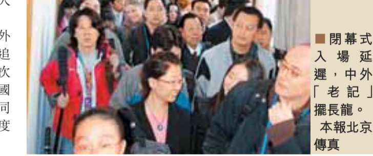
閉幕式入場延遲，中外「老記」擺長龍。