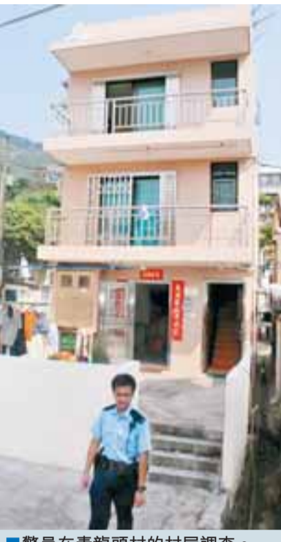
警員在青龍頭村的村屋調查。

【本報訊】11歲百厭男童，繼玩火燒兄長、偷錢及戲弄長輩後，昨晨又在家中以打火機玩火期間，燃着專注傾電話的祖父恤衫，在闖下大禍後嚇至倉皇逃出屋外「着草」，幸祖父及時察覺用水將身上火焰救熄，但因背部輕微燒傷送院治理。事後有街坊不值男童劣行，向到場警員供出他匿藏之處，終將男童拘捕。