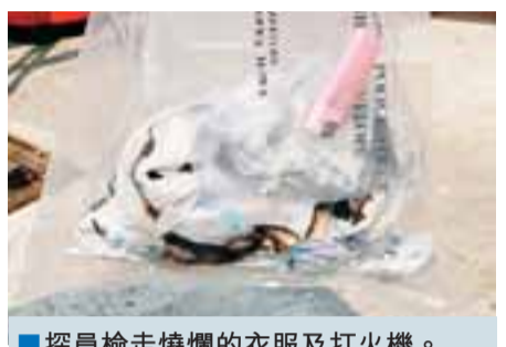
探員檢走燒爛的衣服及打火機。