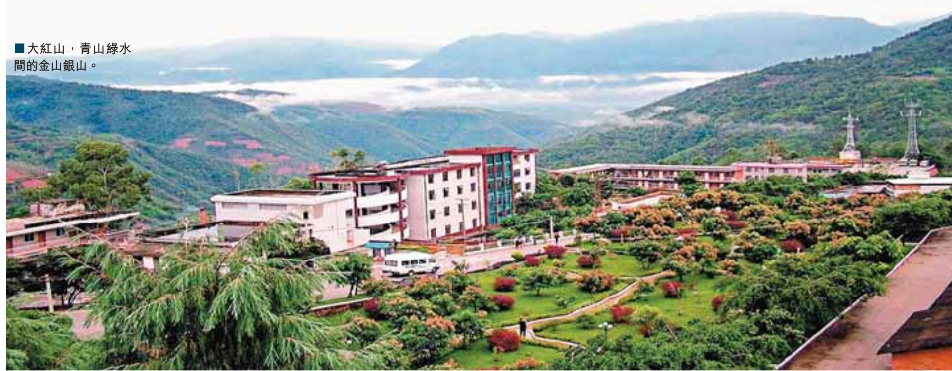
大紅山,青山綠水間的金山銀山。

自古以來,安居樂業就是人們的夢想。《漢書·貨殖列傳》「各安其居而樂其業」的表述,不知曾激勵多少人為之奮鬥。 如今,在地處邊疆的雲南,在以「職工為本」的雲銅,這個夢想正在變成現實。「我們提出『職工為本、和諧為先』,是對『以人為本』在企業實踐中的具體闡釋。『以人為本』不是空洞的概念,讓每個職工都能安居樂業,使全體職工人盡其才、各得其所而又和諧相處,是我們過去、現在和將來一直在努力的現實目標。」雲銅集團董事長、總經理鄒韶祿說。 本報駐雲南記者 周亞明 錢林桃 原曉暉