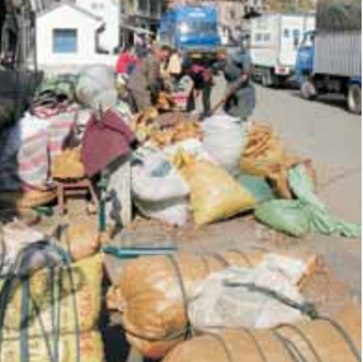
■過去打獵常用的砍刀，如今用在加工核桃上，竟也同樣集裝散地。