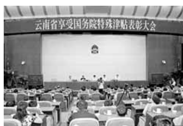
■雲南省享受國務院特殊津貼表彰大會