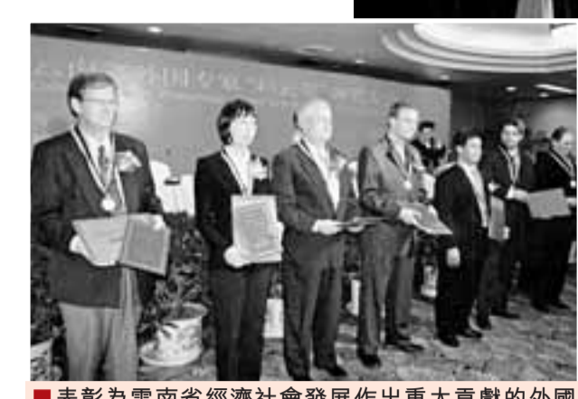
■表彰為雲南省經濟社會發展作出重大貢獻的外國專家

2006年是雲南省人事人才工作改革攻堅的一年。在雲南省委、省政府的領導下，雲南省人事廳認真貫徹科學發展觀，大力實施人才強省戰略，圍繞構建和諧人事，統籌兼顧，各項工作異彩紛呈，引人注目。由於成績顯著，多項工作得到雲南省委、省政府和國家人事部的表彰和肯定。