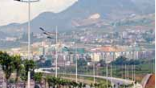
■州府六庫鎮新區日趨成形