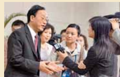
■新聞發佈會後，劉敬民仍被在場記者包圍提問。

【本報十七大報道組北京19日電】根據十七大會務組安排，北京市副市長、北京奧組委執行副主席劉敬民新聞發佈會乃是次大會最後一場新聞發佈會，而「北京奧運會籌備」主題也吸引了眾多中外記者，因而吸引大批記者參加。新聞發佈會上各式問題不斷拋出，劉敬民成為四場新聞發佈會中回答問題最多的代表，儘管如此，直到最後一刻還有眾多記者舉手示意要提出問題。