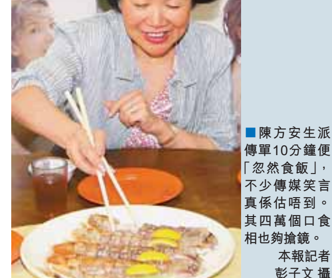
■陳方安生派傳單10分鐘便「忽然食飯」，不少傳媒笑言其係四圍口食相也夠搶鏡。

陳方安生期望，中央可直接多聽立法會各黨派議員的心聲，她即可成為溝通橋樑，又聲音「關鍵不在於中央聽不聽我陳方安生的意見，最重要是「香港700萬市民的真正意向及心聲，有幾多成可以傳達到中央」。