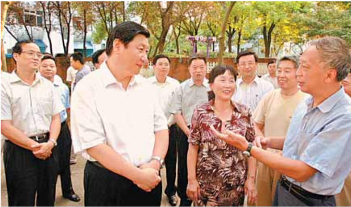
■上海市委書記習近平(左二)與徐匯區社區居民親切交談，左一為徐匯區區委書記茅明貴。

對於土地資源豐富的徐匯區來說，房地產業一直是推動經濟發展的支柱產業。在2003年，該區產業結構中，房地產佔有「龍頭老大」的角色，其稅收約佔全區總稅收的30%。另一方面，區內的濱江地段仍有8.7平方公里的土地可供開發。但是，就在「房地產」被炒得熱騰騰的當口，徐匯區委、區政府領導的頭腦卻異常冷靜。他們認為房地產業儘管處在走勢強勁的巔峰期，但作為資金密集型、資源佔用型產業，容易因人口大量導入而造成不平衡，對區域經濟的可持續發展帶來諸多不確定因素，而發展現代服務業，由於其高增值、強輻射、廣就業的特點，不僅有利於提升產業能級，優化產業結構，而且能迅速轉變區域經濟增長方式，更好地實現中央和上海市九次黨代會提出的「四個率先」的目標。為此，徐匯區委、區政府果斷地作出了「戰略轉型」的決策，引導區內企業和資金走出地產項目，引向現代服務業的配套開發，經過短短三年的「盤整」，該區支柱產業發生了變化，原先獨佔鰲頭的房地產業被現代服務業取而代之，現代服務業營業收入由130億元驟升至450億元，稅收也翻了三番，由9.68億元增至28.1億元，區域經濟發展完成了一個漂亮「轉身」。