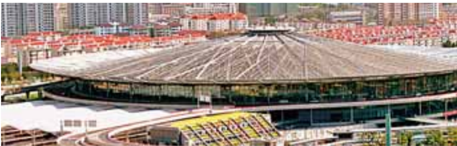
■位於徐匯區的交通樞紐站——上海南站

傾力發展現代服務業，徐匯區委、區政府領導無論大會小會逢會必講，全區上下也都形成了共識，並落實到行動上。在他們規劃的「藍圖」中，現代服務業「1+6」行業結構清晰地「浮出水面」。「1」是指一個核心競爭產業群——信息服務業；「6」是指6個重點行業：即專業服務業、科技研發服務業、生命健康服務業、國際交流和教育培訓服務業、文化旅游會展服務業、金融服務業。在「1+6」產業架構的基礎上，作為吸引和承載現代服務業的載體，該區還將形成徐家匯知識文化綜合商務區、楓林生命科學園區、鐵路上海南站交通商務服務區、漕河涇現代服務業集聚區、淮海—東瀾現代商務商貿區等5個重點集聚區，每一個集聚區都打上了鮮明的地域特色烙印。