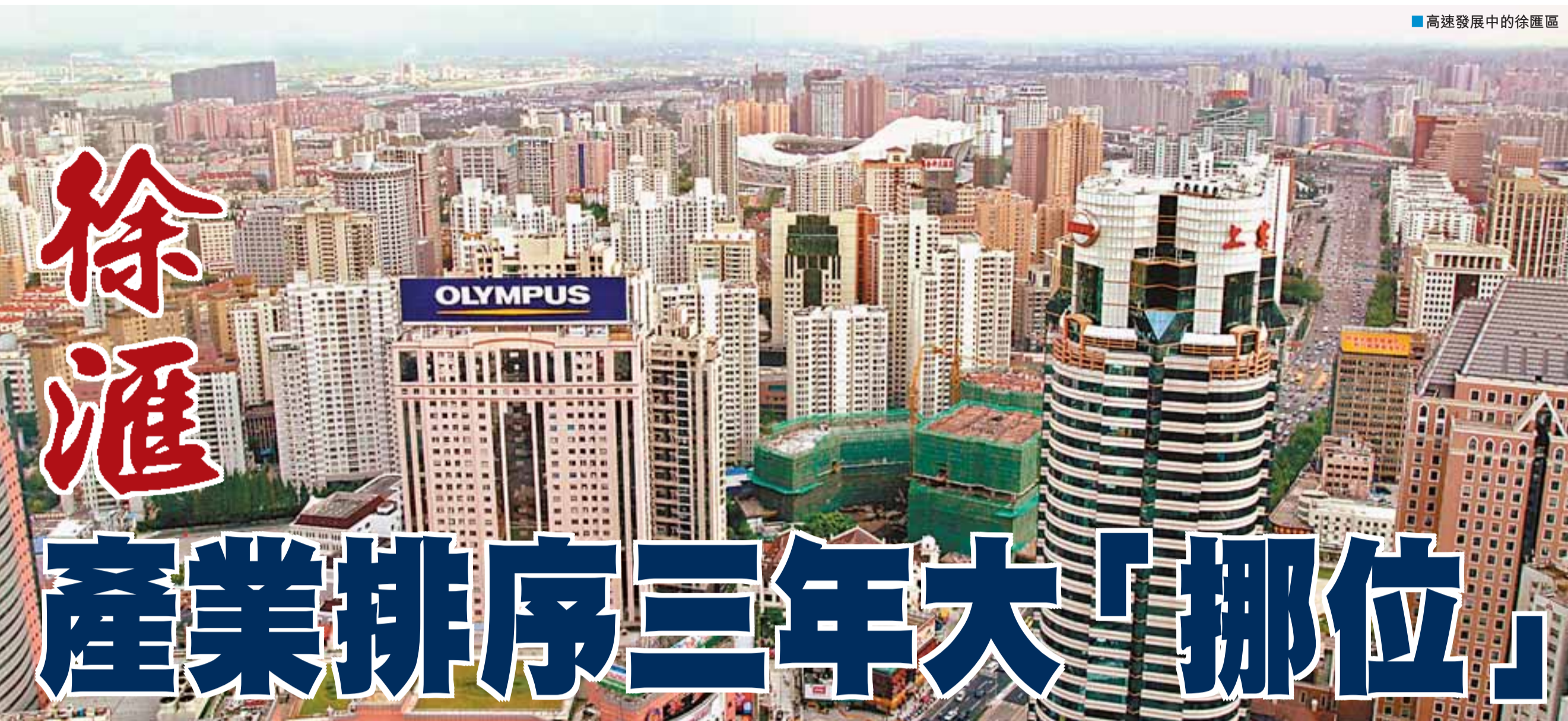
■高速發展中的徐匯區