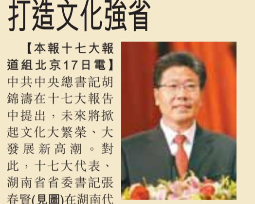
張春賢(圖)在湖南代表團開放討論會上表示，湖南文化產業未來發展勢頭良好，欲把湖南打造成文化強省。

【本報十七大報道組北京17日電】中共中央總書記胡錦濤在十七大報告中提出，未來將掀起文化大繁榮、大發展新高潮。對此，十七大代表、湖南省委書記張春賢(見圖)在湖南代表團開放討論會上表示，湖南文化產業未來發展勢頭良好，欲把湖南打造成文化強省。