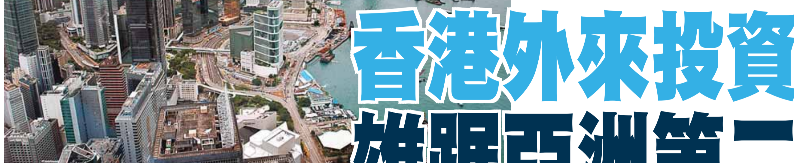
香港在吸引全球外來直接投資方面持續錄得大幅增長，連續五年雄踞亞洲第二，僅次於中國內地。

【本報訊】(記者 李永青) 聯合國貿易和發展會議的《2007年世界投資報告》顯示，香港在2006年全球外來直接投資總額錄得大幅增長，共吸引429億美元(折合3346.2億港元)流入，較2005年同期上升28%，為有紀錄以來的第二高數字。在全球外來直接投資目的地中，香港再度高踞亞洲第二，僅次於中國內地。引資數字並再次拋離新加坡，而全球排名則由第8位升至第7位。