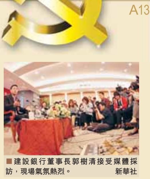
建設銀行董事長郭樹清接受媒體採訪，現場氣氛熱烈。