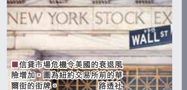
信貸市場危機令美國的衰退風險增加。圖為紐約交易所前的華爾街的街景。

整個1987年10月下來，各地主要股市累積跌幅如下： ■香港：全月下跌45.8% ■悉尼：全月下跌41.8% ■倫敦：全月下跌26.4% ■紐約：全月下跌22.6% ■多倫多：全月下跌22.5%