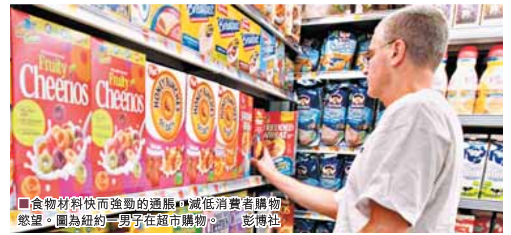
食物材料快而強勁的通脹，減低消費者購物慾望。圖為紐約一男仔在超市購物。彭博社

1987年10月19日，美國道瓊斯工業平均指數急瀉508點，跌幅達22.6%，5,600億美元（約4.3萬億港元）市值在一日間蒸發並引發全球大股災。明日便是87股災20周年，現時全球股市一體化，各地股市都在高位徘徊，信貸危機仍纏擾市場。前美國聯儲局主席格林斯潘表示，現在世界金融市場的景象，與87年股災時十分相似。而現任美國聯儲局主席伯南克早前便宣布大幅減息救市，歐美則注入近十萬億美元資金，紓緩信貸短缺。這些措施雖暫時穩住市場信心，但近日全球股市大幅波動，通脹猛虎又蠢蠢欲動，令市場擔憂20年前的噩夢會再降臨。