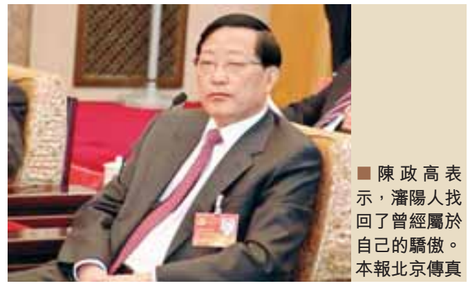
陳政高表示，瀋陽人找回了曾經屬於自己的驕傲。本報北京專真

【本報十七大報道組北京17日電】十七大代表、瀋陽市委書記陳政高在16日遼寧代表團團外討論會上發言時透露，時下在瀋陽有一種很流行的說法，就是「瀋陽人終於找回了曾經屬於自己的驕傲」。從中可以看出瀋陽和瀋陽人的變化。陳政高稱，瀋陽有「東方魯爾」和「共和國的裝備部」美譽，瀋陽裝備製造業已經100多年，形成了深厚的工業文化傳統。有日本記者在報道中提到，在瀋陽一個自行車修理部都能找到工廠工人。前幾年還有一位廣東省長的領導到瀋陽訪問時說，瀋陽的一個工人到廣州都能當車間主任。陳政高指，瀋陽訓練有素的產業工人是瀋陽的寶，也是外國看好瀋陽裝備製造業的原因。