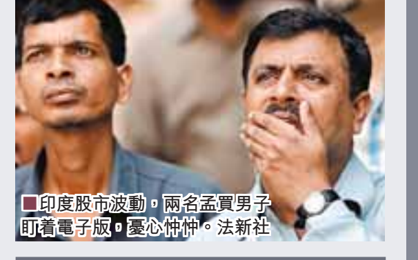
印度股災波動，兩名孟買男子盯著電子版，憂心忡忡。