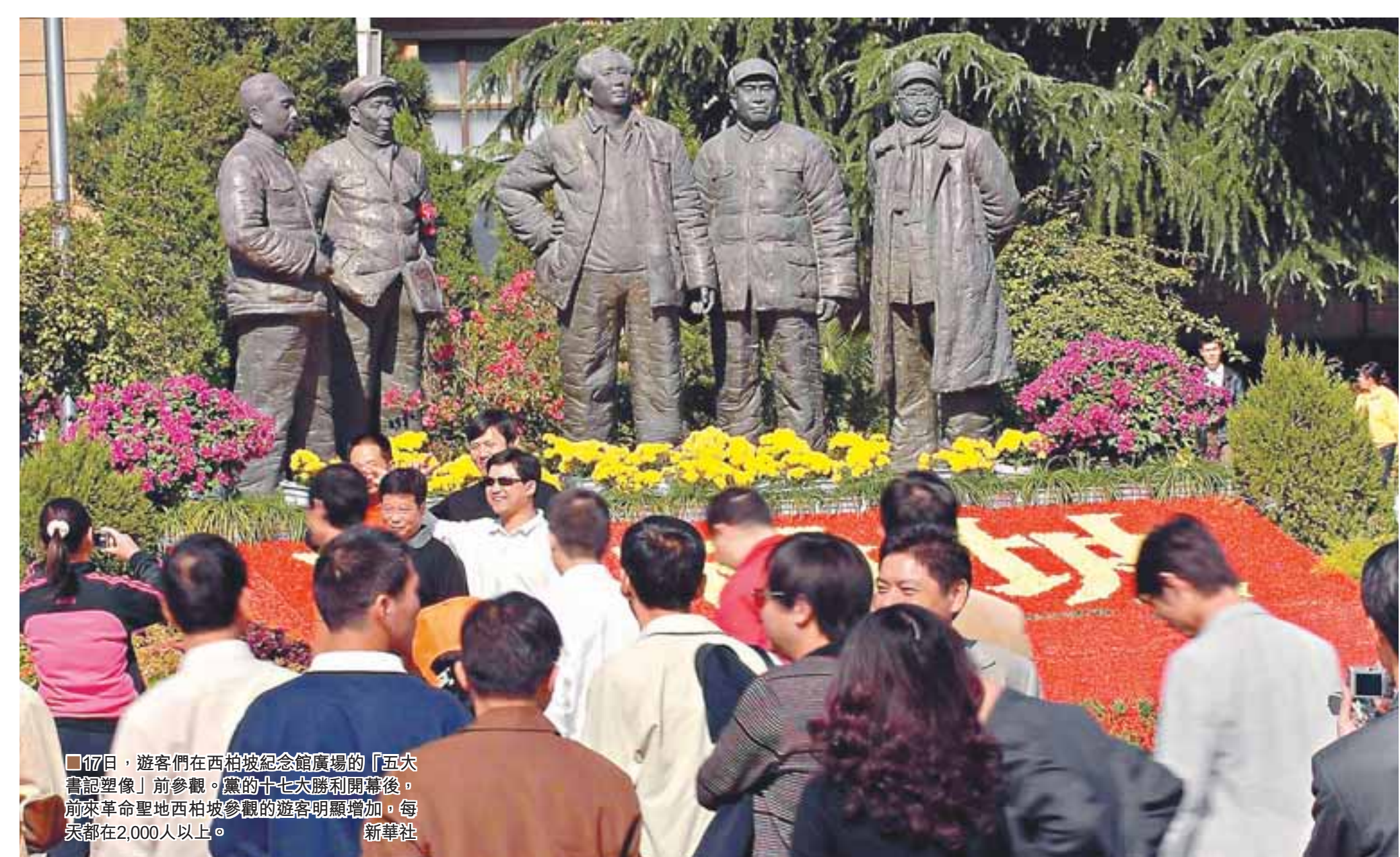
17日，遊客們在西柏坡紀念館廣場的「五大書記塑像」前參觀。黨的十七大勝利開幕後，前來革命聖地西柏坡參觀的遊客明顯增加，每天都在2,000人以上。新華社

在16日下午的陝西團外開放日上，本報記者分別採訪了省委書記趙樂際、省長袁純清及延安市委書記李希。趙樂際表示，將認真組織全省對十七大報告的學習，盡快把各方面的工作提高到十七大的要求上來，使陝西實現又好又快發展。袁純清也表示，自十六大後，陝西已拿出318億元用於民生。據李希介紹，自1999年實行退耕還林政策以來，國家給延安投入42億元，已惠及農民120萬人。