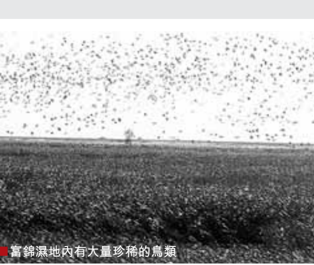
■富錦濕地內有大量珍稀的鳥類