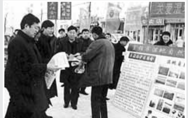
■市領導親自上陣，進行濕地保護宣傳。