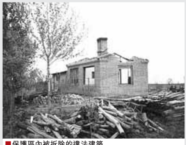
■保護區內被拆除的違法建築

在充分調查分析的基礎上，結合當地實際，富錦市組織有關部門專家進行科學的論證。大家一致認為，必須進行管理秩序的整頓，採取行政干預，統一管理。最終經市委常務會議研究決定，堅持從重、從快、從嚴的原則，嚴厲打擊各種破壞濕地的違法行為。如發現黨政機關工作人員有參與破壞濕地的違法行為的，在黨紀、政紀處理上一律從重處理。為了使「決定」落實到位，富錦市政府還選拔保護區管理統一管理的相關事宜下发了十四條緊急通知。