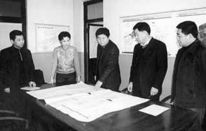
■富錦市委書記劉臣（左三）與三環泡濕地保護區管理局領導班子在研究濕地保護問題