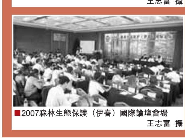
■2007森林生態保護（伊春）國際論壇會場