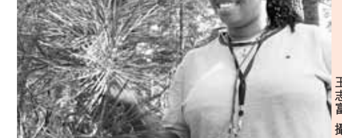
■加達學者正在仔細觀察紅松

抓住林區特點，推進資源型城市經濟轉型。長期以來，林區經濟發展和森林生態保護似乎是一對非此即彼、不可調和的矛盾，單一的產業結構和對資源過度依賴的經濟增長方式，使伊春的林區經濟幾乎走進了死胡同。深入思考，還是發展路徑不合理、發展模式不科學造成的。因此，伊春把加快林區經濟轉型作為解決這種矛盾的根本途徑，加快了主軸換位的步伐，重點發展了生態畜牧、生態旅遊、綠色食品、藥材種植和加工、綠色能源等接續替代產業。自伊春被評為中國最佳生態旅遊城市後，伊春的綠色食品、生態旅遊等特色產業發展迅速，「伊春」已經成為全國知名的綠色品牌。目前，伊春的替代產業已經佔據了全市生產總值的半壁江山，而且發展勢頭強勁，過去靠砍木頭生存的林區，已經開始走出了一條寬廣的接續替代產業發展之路！