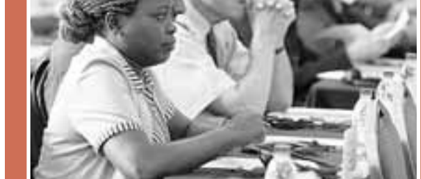
■參加論壇的外國使節、專家和學者。