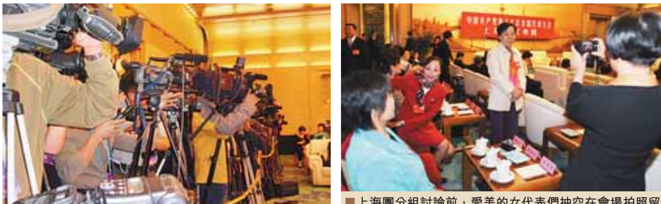
■上海團分組討論前，愛美的女代表們抽空在會場拍照留念。

來自日本、韓國、德國、澳大利亞等地的外國記者，對上海團的興趣濃厚。他們不僅關心社保案等熱點問題，對每一