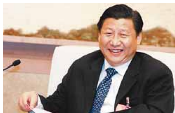
■上海市委書記習近平。

【本報十七大報道組北京16日電】今天是本十七大期間上海代表團唯一一次向中外媒體團開放日，吸引了過百家媒體的採訪。上海市委書記習近平在發言中，暢談對胡總報告的體會。他表示：上海將從調整產業結構、加快節能降耗、建設創新型城市、城鄉協調發展以及更加關注民生等五個方面，着力推進「科學發展觀」的落實。