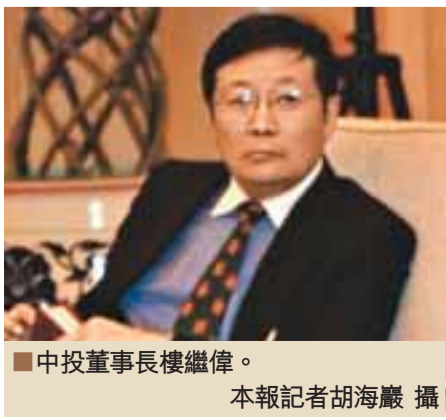
中投董事長樓繼偉。

樓繼偉：中投投資範圍涵蓋港台 匯區以外的所有市場，包括香港和台灣。樓繼偉表示，中投公司將實行商業化運作，確保實現兩大目標：在可接受的風險範圍內實現股東權益最大化；同時改進所投資金融機構的治理。