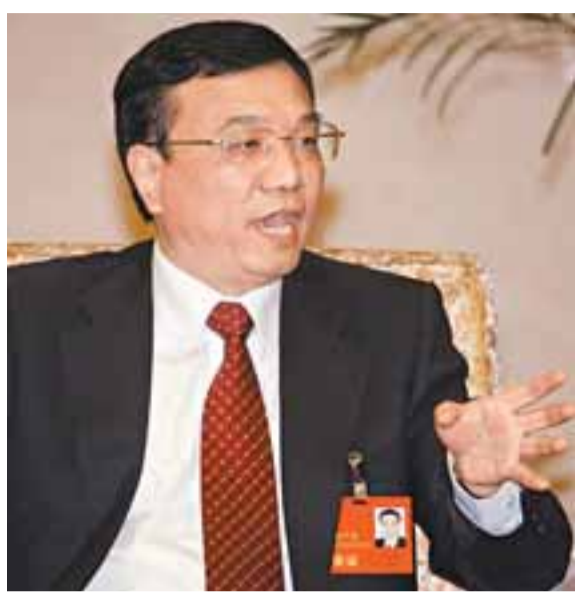
李克強表示，建設和諧社會必須從重點民生問題入手。

【本報十七大報道組北京16日電】以省委書記李克強為團長的十七大遼寧代表團今天向媒體開放團組討論，中外記者蜂擁而至。遼寧團代表62名，前來採訪的記者有173名，記者人數竟為代表的三倍之多！