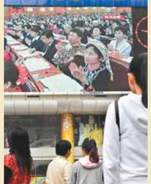
15日，市民在南京新街口街頭大屏幕前觀看十七大開幕會電視直播。