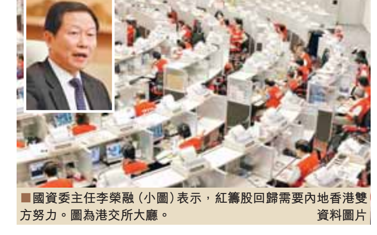
國資委主任李榮融(小圖)表示，紅籌股回歸需要內地香港雙方努力。圖為港交所大廳。 資料圖片

【本報十七大報道組北京15日電】中共十七大揭幕，下午舉行分組會，除了開放更多團組給中外記者旁聽，更首度允許記者提問。國有資產監督管理委員會主任李榮融在中央企業系統分組討論時表示，紅籌股回歸需要雙方努力，現在內地與香港的合作已經有相當的深度，這個難題不久就會解決。 李榮融還表示，中央企業很重視香港的資本市場，在感謝香港投資者支持的同時不會忘記香港投資者，中央企業日後還繼續到香港市場。他指出，香港正逐步成為國際金融中心，在新的條件下，香港的資本市場也需要改進一下，讓香港的資本市場發展更好。 回應寶鋼非減持試點 李榮融表示，國資委對海外的投資者持歡迎的態度，