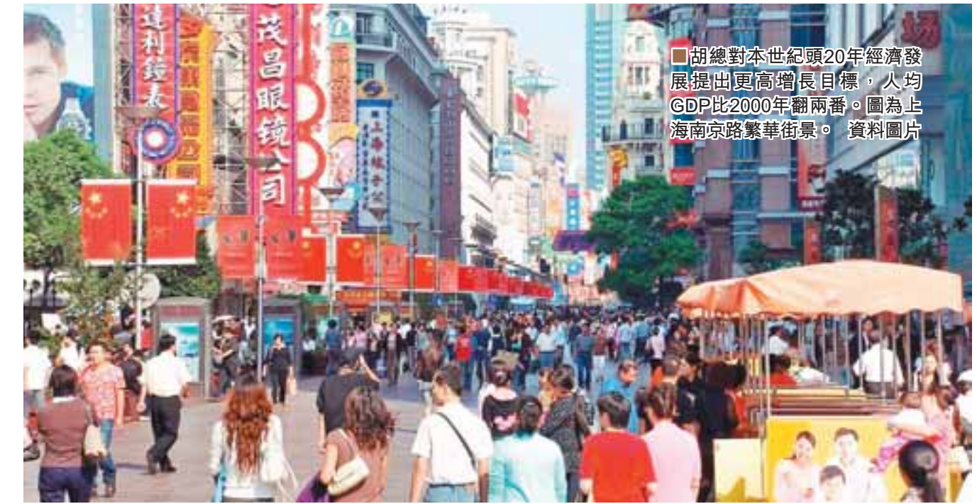
胡總對本世紀頭20年經濟發展提出更高增長目標，人均GDP比2000年翻兩番。圖為上海南京路繁華街景。

【本報十七大報道組北京15日電】胡錦濤總書記今日在十七大報告中全面畫出中國未來13年的經濟發展宏圖，對本世紀頭20年的經濟發展提出更高增長目標。此間經濟分析人士指出，與十六大相比，十七大經濟發展目標有4大變化，實現2020年經濟增長目標後，中國經濟總量將居世界第3位。 在本世紀頭20年全面建設小康社會的奮鬥目標，是2002年中央在十六大報告中提出的。分析人士指出，經過5年的發展，本次十七大再提「全面建設小康社會的奮鬥目標」，已與十六大有所變化。 變化一：GDP翻兩番 人均GDP翻兩番 5年前的十六大報告提到，全面建設小康社會的主要目標是，國內生產總值到2020年力爭比2000年翻兩番。當時，沒有使用「人均」一詞。 分析人士也認為，「人均」概念的使用，表明中國決策者更加注重考慮經濟之外的社會因素，比如人口增長的問題。