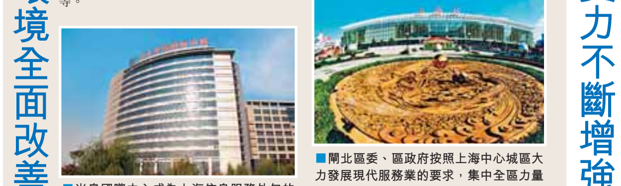
■半島國際中心成為上海信息服務外包的重要基地。

為迎接奧運會、世博會，提升開北現代城區形象，區委、區政府加大投資的力度，舊區改造成效顯著。通過努力，四年來實施舊房區整修408.89萬平方米，完成平改坡綜合改造181.78萬平方米，使全區12.61萬戶群眾居住條件得到改善。政府始終把解決困難群眾住房問題放在首位，不斷擴大廉租住房受益面，累計受理1822戶，配租1586戶。舊區改造的加快，改變了城區的面貌，現代賽車城、慧芝湖和大寧國際小學的竣工，標誌着現代化國際社區在開北中部地區的形成。