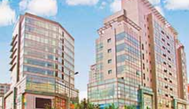
■新興的大寧國際商業廣場，人氣日益旺盛，已經逐步成為開北的新地標。

開北區委、區政府按照上海中心城區大力發展現代服務業的要求，集中全區力量培育重點產業，打造現代交通商務服務業。圖為開北地標——上海火車站。