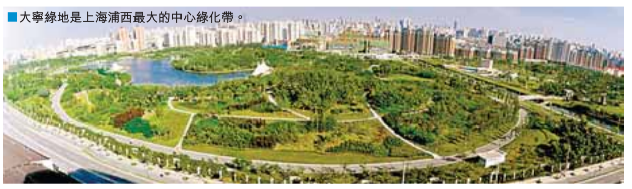
■大寧綠地是上海浦西最大的中心綠地帶。

在發展現代交通服務業方面，開北區擁有着得天獨厚的優勢。目前，區內有9家長途汽車客運站，設有9個站點，通往11個省、轄市方向，共有班線1007條。佔上海長途汽車客、貨運輸量的50%以上；有公共交通始發線和過境線187條，佔全市公共線路33.27%，建成了為交通運輸配套服務的服務業。