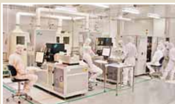
■清芯光電有限公司生產現場