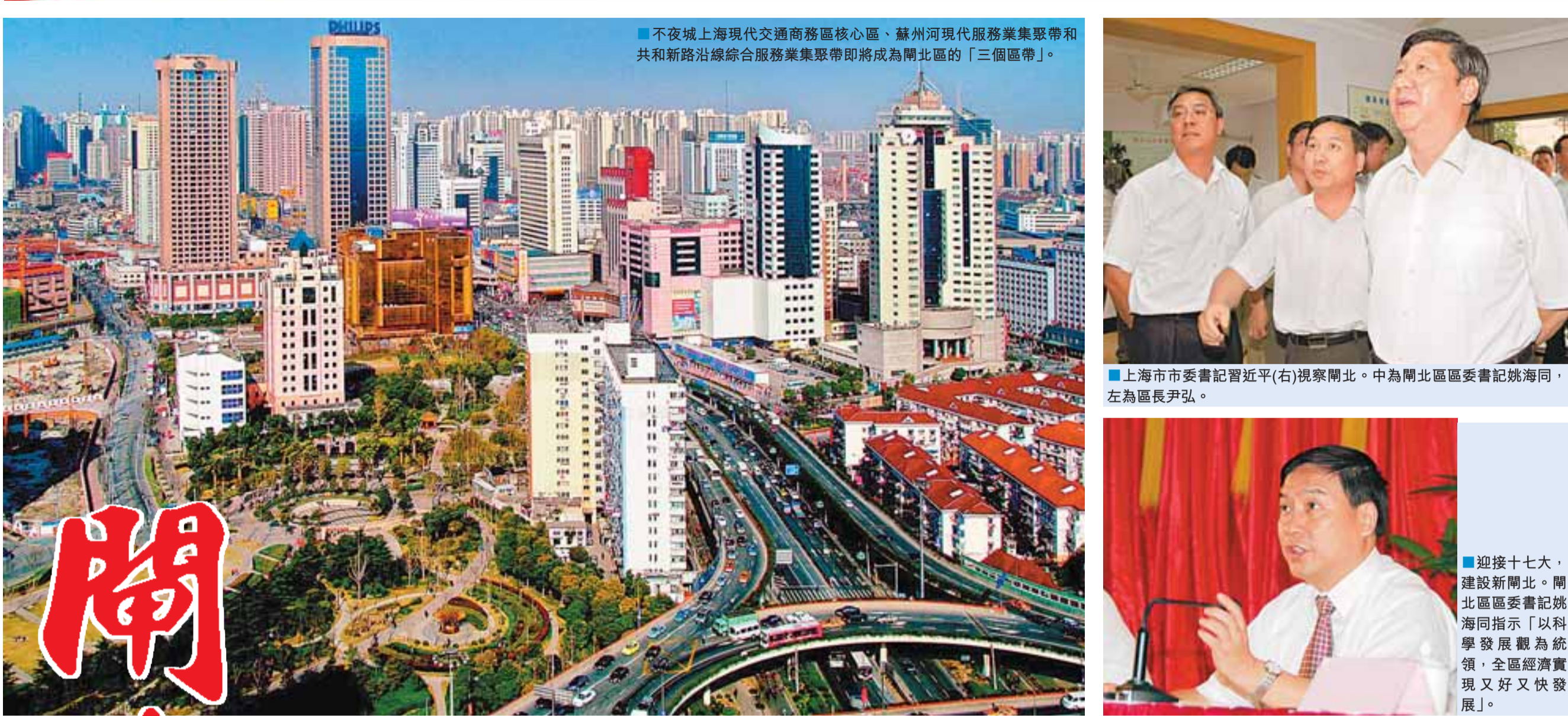
■不夜城上海現代交通商務區核心區、蘇州河現代服務業集聚帶和共和新路沿線綜合服務業集聚帶即將成為開北區的「三個區帶」。