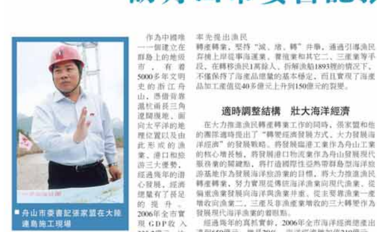
舟山市委書記張家盟在大陸連島工程現場

與此對應，該市正大力推動「四資聯動」，即堅持引進外資與優化結構、廣商引資、招才引智相結合，提高利用外資的質量和水平；爭取通過資本投入交流、能源、電力、通訊等基礎設施和重化工業項群；引導一批上規模民營企業通過國內、境外和買殼等多渠道上市；進一步激發民間資本活力，積極鼓勵投資創業。同時，鼓勵企業「走出去」，開展對外投資和跨國經營，開發重要資源性基地，拓展產業發展空間，推動產業梯度轉移。通過加快轉變外貿增長方式，大力支持自主品牌產品和機電產品、高新技術產品出口，增加先進技術裝備和重要資源的進口，着力發展服務貿易。