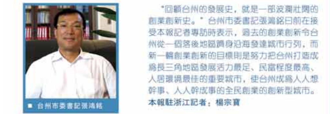
台州市委書記張鴻銘

“回顧台州發展史，就是一部波瀾壯闊的創業創新史。”台州市委書記張鴻銘日前在接受本報記者專訪時表示，過去的創業創新令台州從一個落後地區躋身沿海發達城市行列，而新一輪創業創新的目標則是努力把台州打造成為長三角地區發展活力最足、民富程度最高、人居環境最佳的重要城市，使台州成為人人想幹事、人人幹成事的全民創業的創新型城市。本報駐浙江記者：楊宗寶