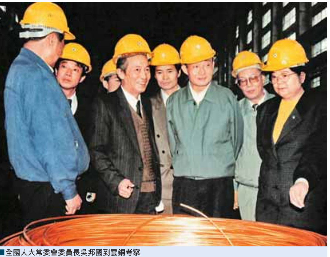
全國人大常委會委員長吳邦國到雲銅考察