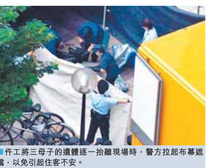
【本報訊】天水圍倫倫慘劇發生後，不幸遇害兩姐弟生前就讀的學校的校長表示，兩姐弟性格乖巧，於校內的表現很良好；慘劇發生後，校方已啟動危機小組，今日會向全體師生交代事件，及找心理學家及社工協助，向有情緒問題的學生提供輔導。

【本報訊】被喻為家庭悲劇重災區的天水圍，昨晨又發生3母子墮樓慘死的悲劇。一名患精神病的