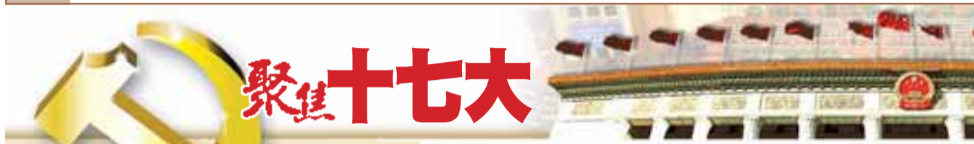
聚首十七大 A2 責任編輯：羅雅蘭

外貿易總額為17607億美元，居世界第三位。2007年，標誌着國家綜合實力的GDP總量將超過23萬億元，較2001年的約11萬億元翻一番有餘；我國外匯儲備有1萬多億美元，位居世界首位。中國經濟社會發展在過去5年間實現了新的跨越，標誌着中國在全面建設小康社會的歷史進程中邁出了新的步伐，使國家的發展站在了新的歷史起點。