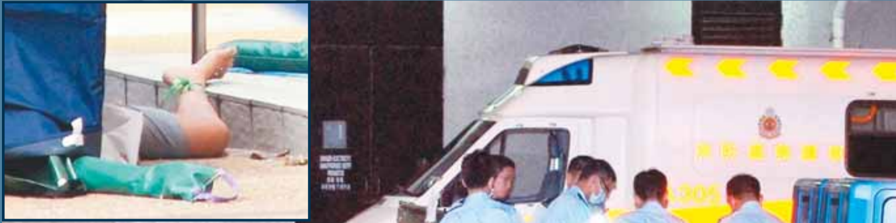
一名窮媽媽，用尼龍繩綁綁一對子女的手腳，將他們從街後跳樓自殺，釀成一屍兩命慘劇。(小圖)女童墮樓後，腳腕仍纏有綠色尼龍繩。

【本報訊】被喻為家庭悲劇重災區的天水圍，昨晨又發生3母子墮樓慘死的悲劇。一名患精神病的