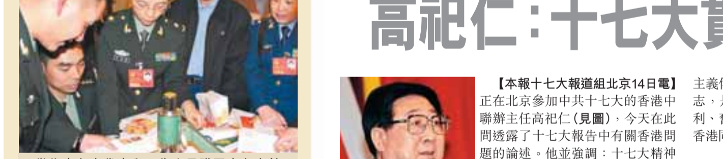
【本報訊】中共十七大代表和工作人員購買十七大首日封後準備加蓋紀念郵戳。