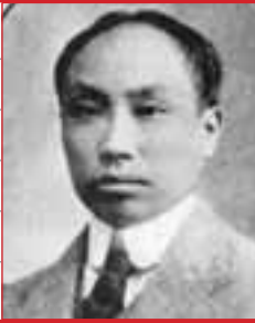
■ 中國共產黨早期領導人陳獨秀。

時間：1922年7月16日至23日 地點：上海 出席代表：12人 全國黨員：195人 中央執行委員會委員長：陳獨秀 主要決議：制定反帝反封建的革命綱領