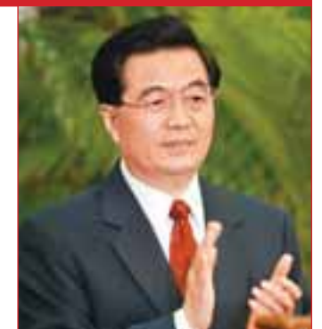
■ 胡錦濤擔任中共十六大秘書長。

時間：2002年11月8日至14日 地點：北京 出席代表：2114人，特邀代表40人 全國黨員：6635.5萬人。 總書記：江澤民 主要決議：提出全面建設小康社會的戰略目標，確立「三個代表」理論寫入黨章，作為黨必須長期堅持的指導思想。