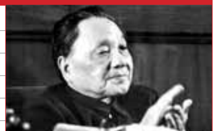
■ 鄧小平成為中國改革開放的總設計師。

時間：1982年9月1日至11日 地點：北京 出席代表：1690人 全國黨員：3965萬人 總書記：胡耀邦 主要決議：提出全面開創社會主義現代化建設的綱領