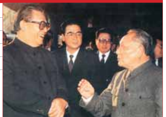
■ 江澤民與鄧小平在中共十三屆五中全會上交談。以江澤民為核心的第三代領導層在這次會議中形成。

時間：1992年10月12日至18日 地點：北京 出席代表：1989人 全國黨員：5100萬人 總書記：江澤民 主要決議：確定建立社會主義市場經濟體制