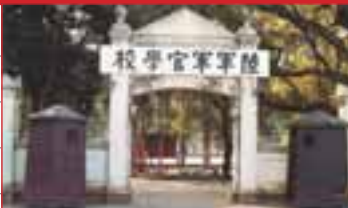
■ 第一次國共合作後建立的黃埔軍校。

時間：1923年6月12日至20日 地點：廣州 出席代表：30多人 全國黨員：420人 中央執行委員會委員長：陳獨秀 主要決議：確定與國民黨合作，建立革命統一戰線