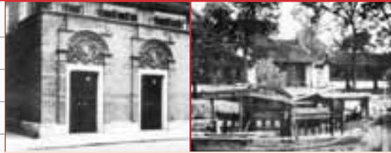
■ 中共一大會址(左)。為躲避搜查，一大最後一次會議移到浙江嘉興南湖一艘遊船上進行。

時間：1921年7月23日至31日 地點：上海 出席代表：12人 全國黨員：50多人 總書記：陳獨秀 主要決議：宣告中共正式成立